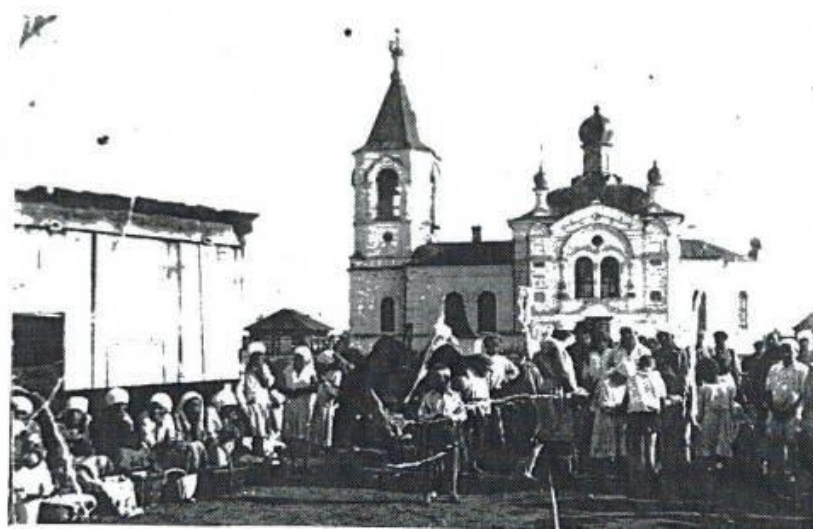
церковь села Каптырево