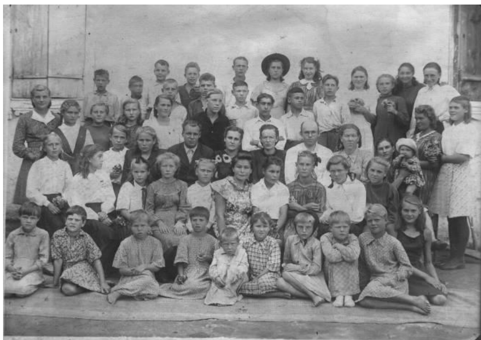
Воспитанники детского дома (фото 1944 - 1945 гг.)