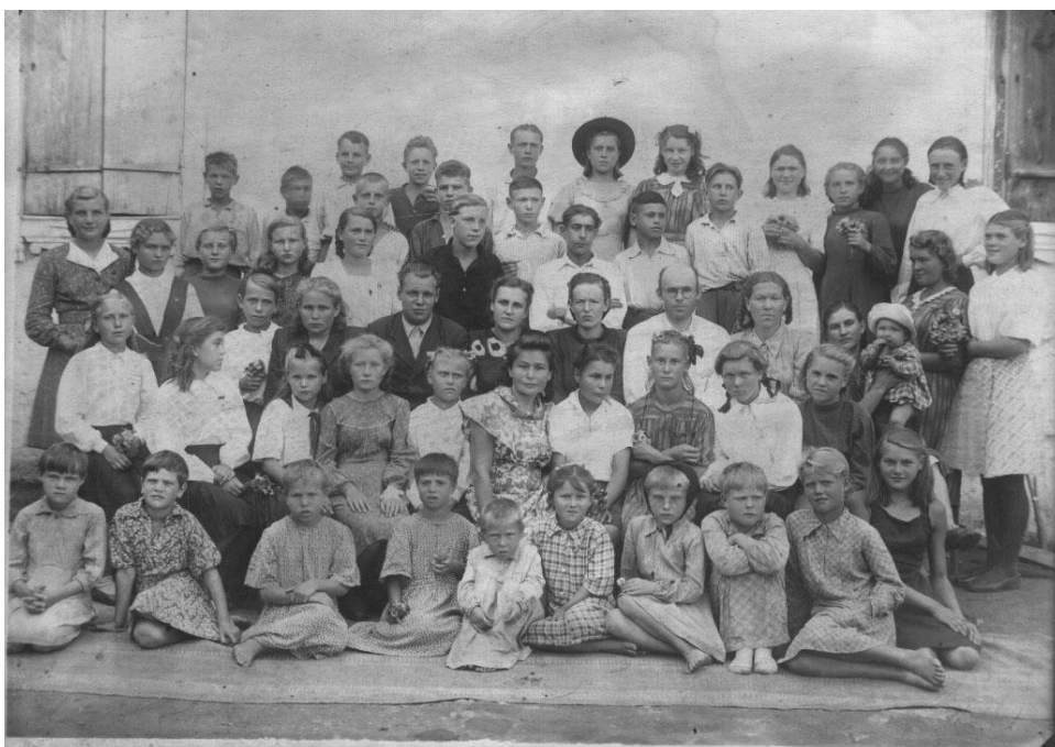
Фото воспитанников, учителей и воспитателей детского дома. 1945 год.