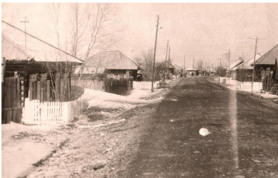
улица Большая село Каптырево 1970г