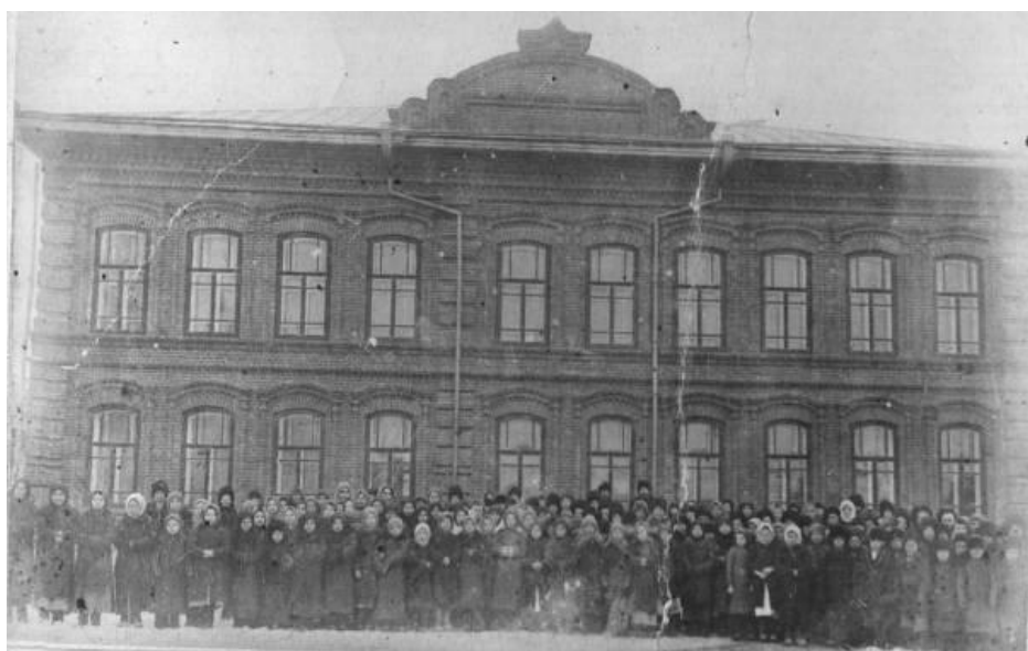
Школа в 1920 – 1922 гг.