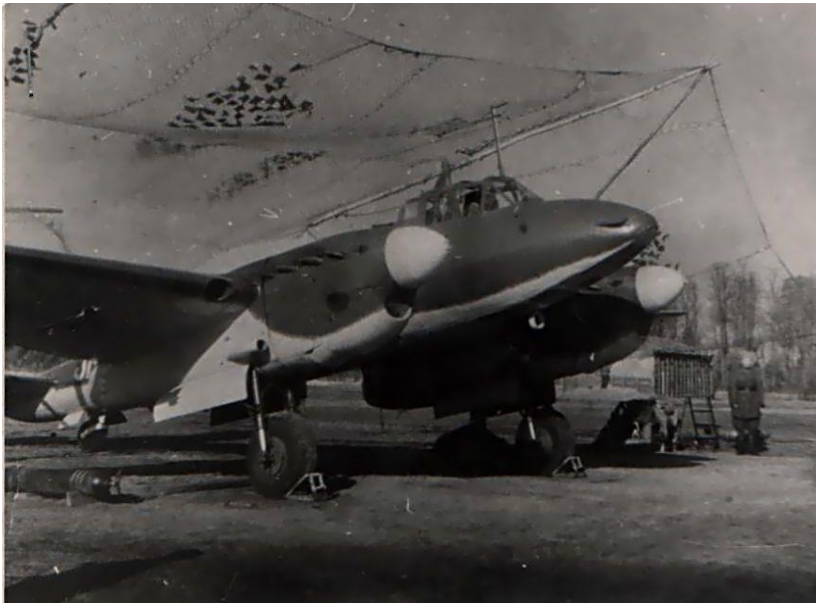
Фото 3. Самолет экипажа В.С. Богуцкого "Пе - 2"

Шло время, рос боевой опыт летчика. Бесстрашие, находчивость и отвага, высокое мастерство помогли ему успешно выполнять порученные задания.