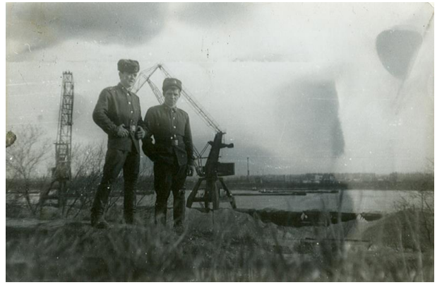
На берегу Дуная.