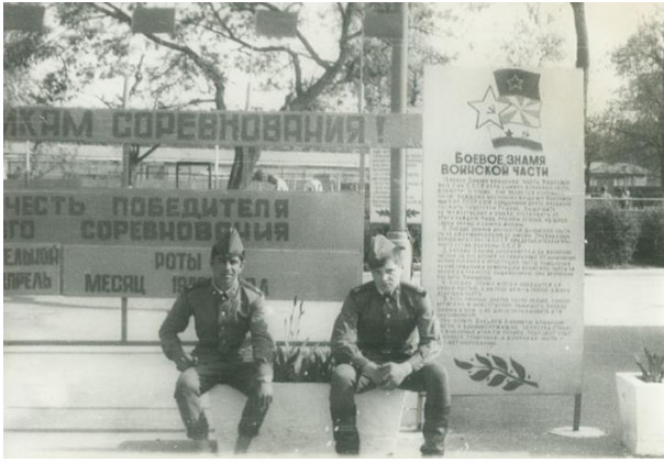
Фото в гарнизоне.