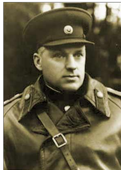
Маршал Советского Союза