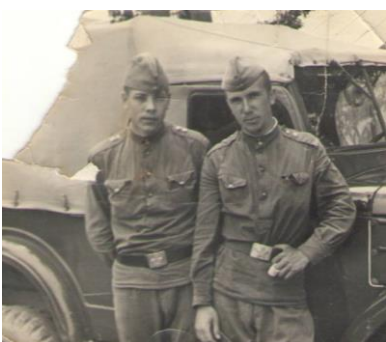
Владимир с товарищем в армии.