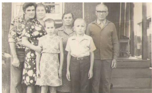
Семья Кренициных в посёлке Смидович.