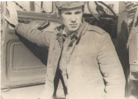
Послеармейская командировка в Кужебаре (ЗИЛ-164).