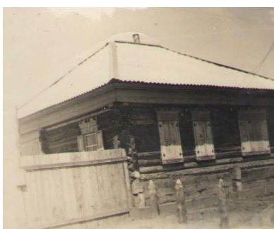
Построенный молодожёнами дом (1975 год).