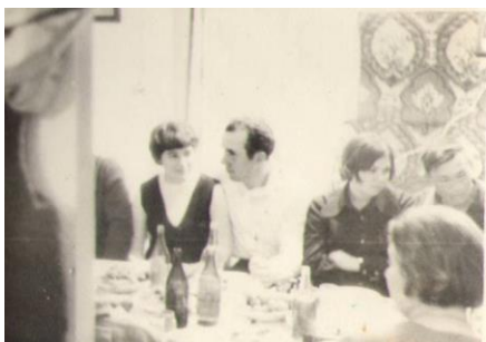
Кужебарская свадьба (1973 год).