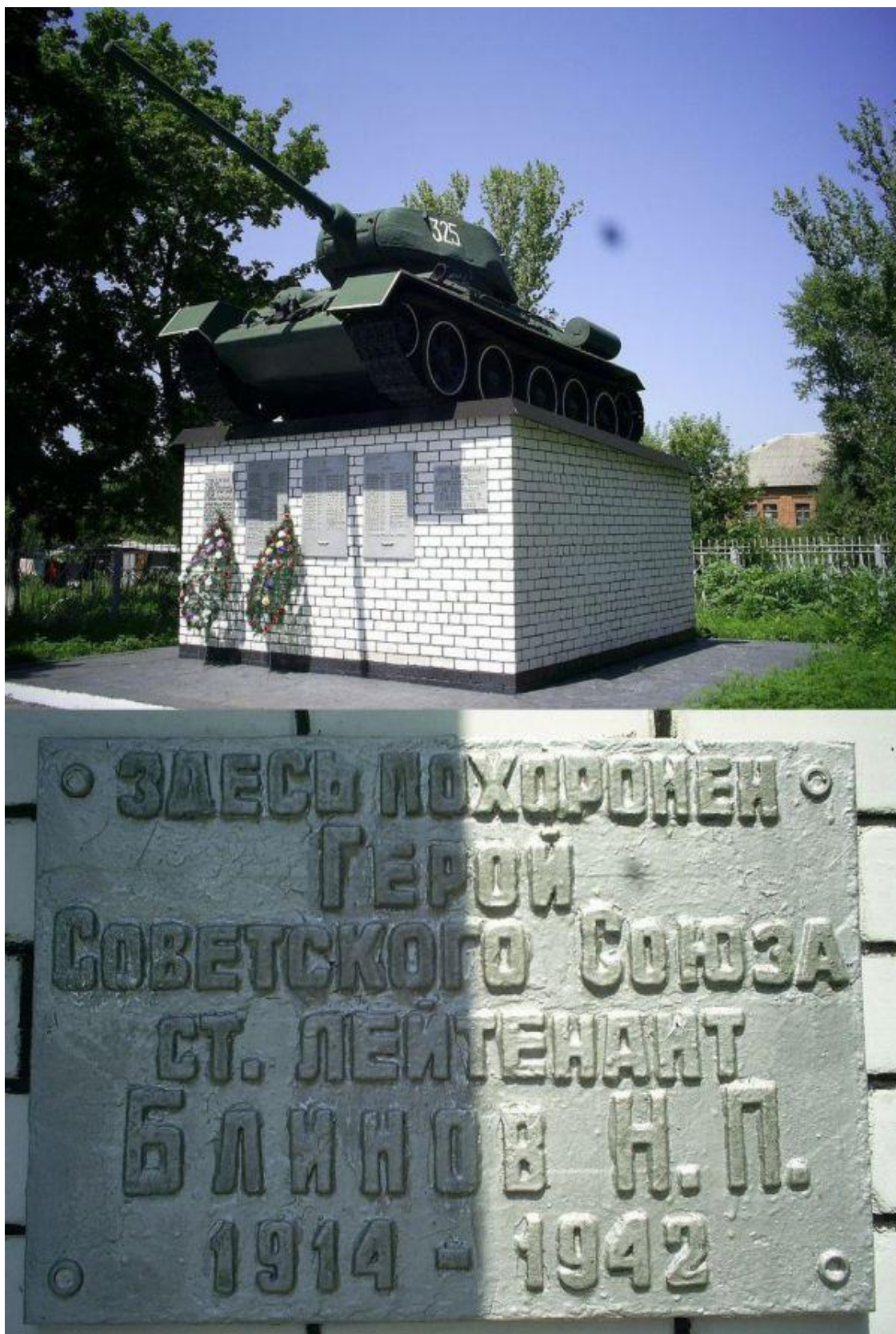
Памятник установленный на братской могиле в посёлке Белый Колодезь Волчанского района Харьковской области Украины. Фото 2011 г.