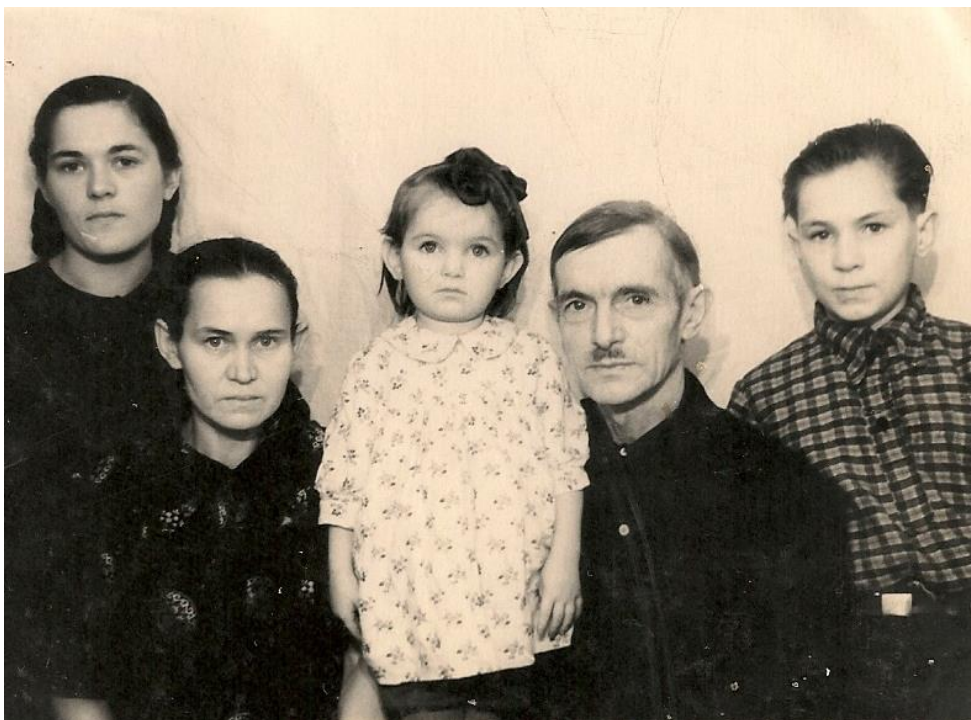
Фото 1. Большая семья Спевачек