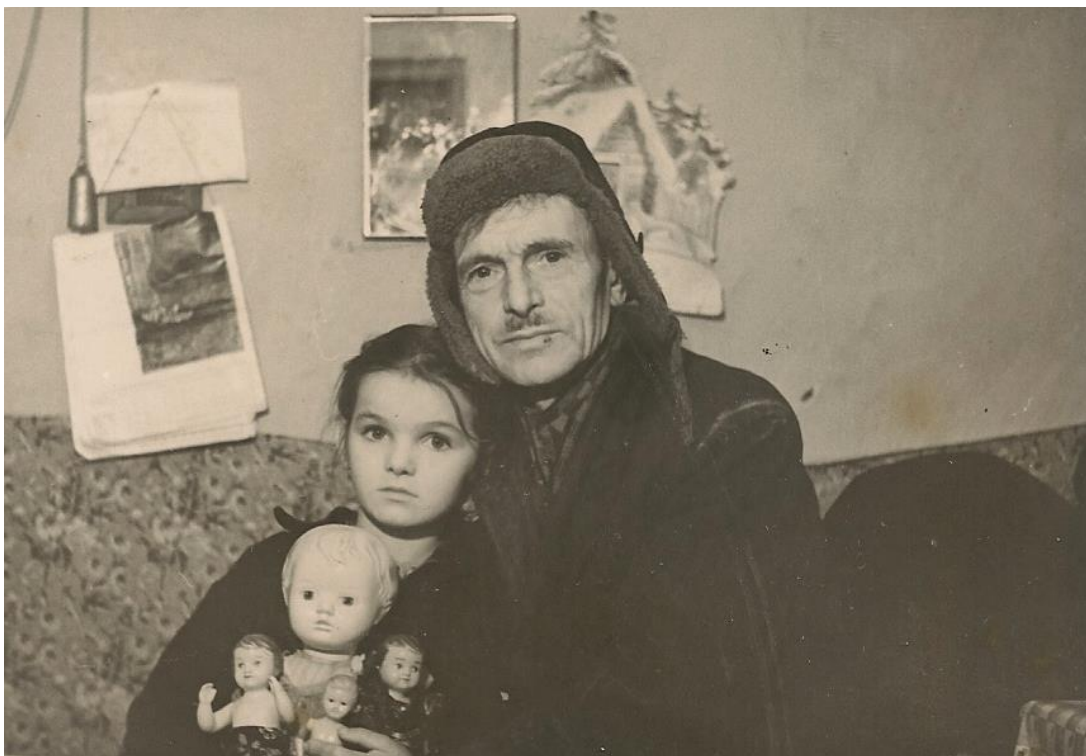
Фото 3. С любимым папой