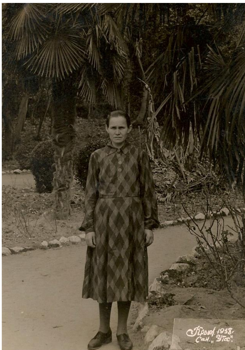
Фото 2. Крым, 1958