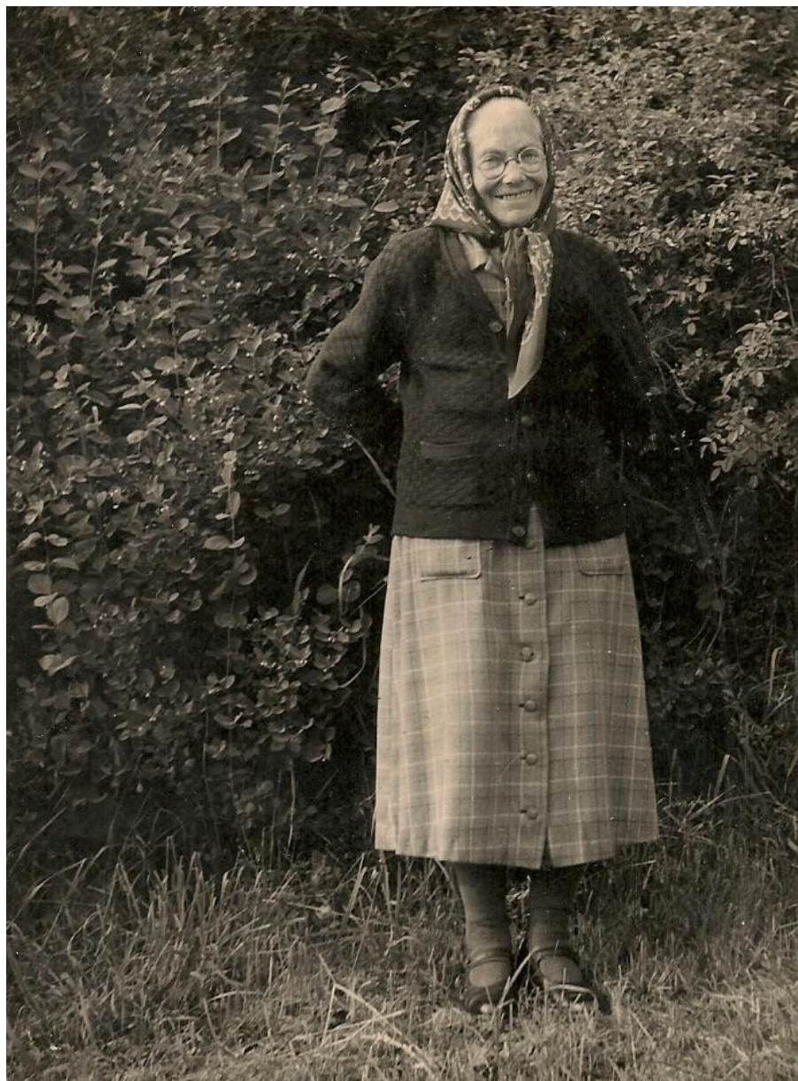
Фото 1. Бабушка