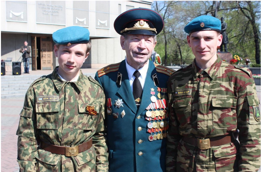
Фото с ветераном 78-ой добровольческой бригады. Апрель . 2014.