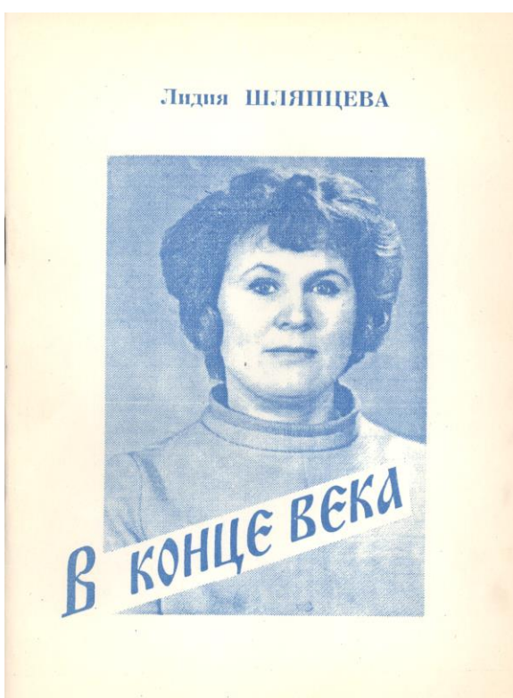
Фото 5. «В конце века» (1997г.)