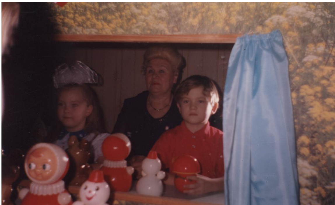
Фото 10. Занятия в логопедической группе