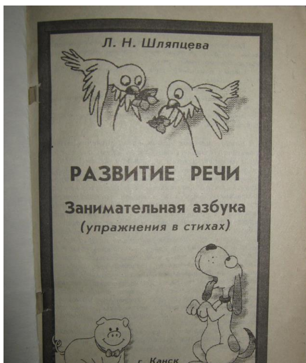
Фото 9. «Развитие речи. Занимательная азбука в стихах» (2001 год)

Работы эти получили высокую оценку преподавателей кафедры коррекционной педагогики Красноярского госуниверситета.