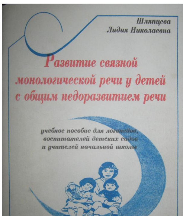
Фото 8. «Развитие связной монологической речи у детей с общим недоразвитием речи» (2000 год)