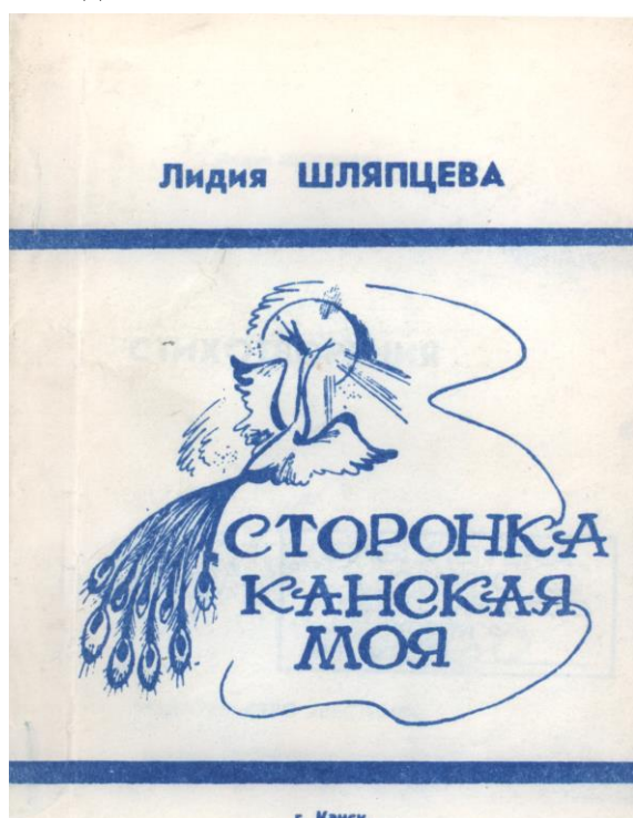
Фото 4. «Сторонка Канская моя» (1992г.)

Мы перечитали все стихи из сборников «Сторонка Канская моя» (Фото 4), «В конце века» (Фото 5), «Полосатое счастье» (Фото 6), «Особый случай» (Фото 7) и выделили основные темы: