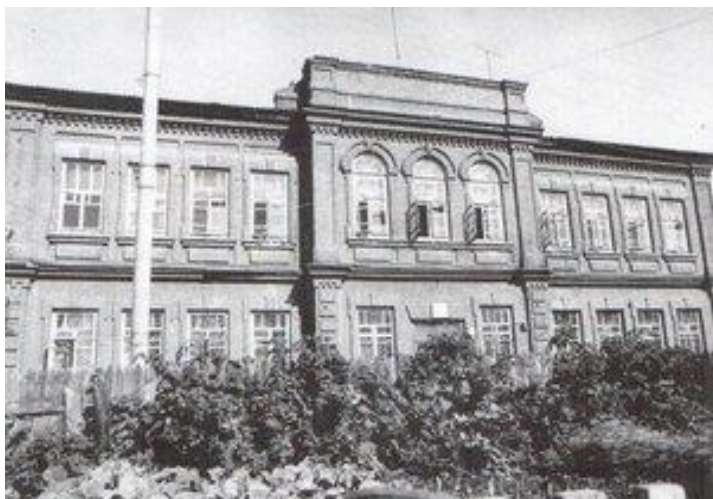
Бывшее приходское училище