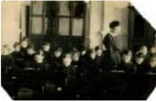
Школа 50-х годов