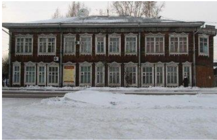
Старое библиотечное училище