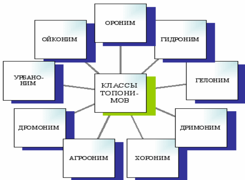
Рис.1 Термины топонимики