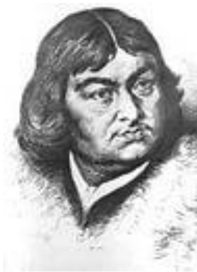
Витус Беринг, совершивший экспедицию на Дальний Восток через Сибирь.