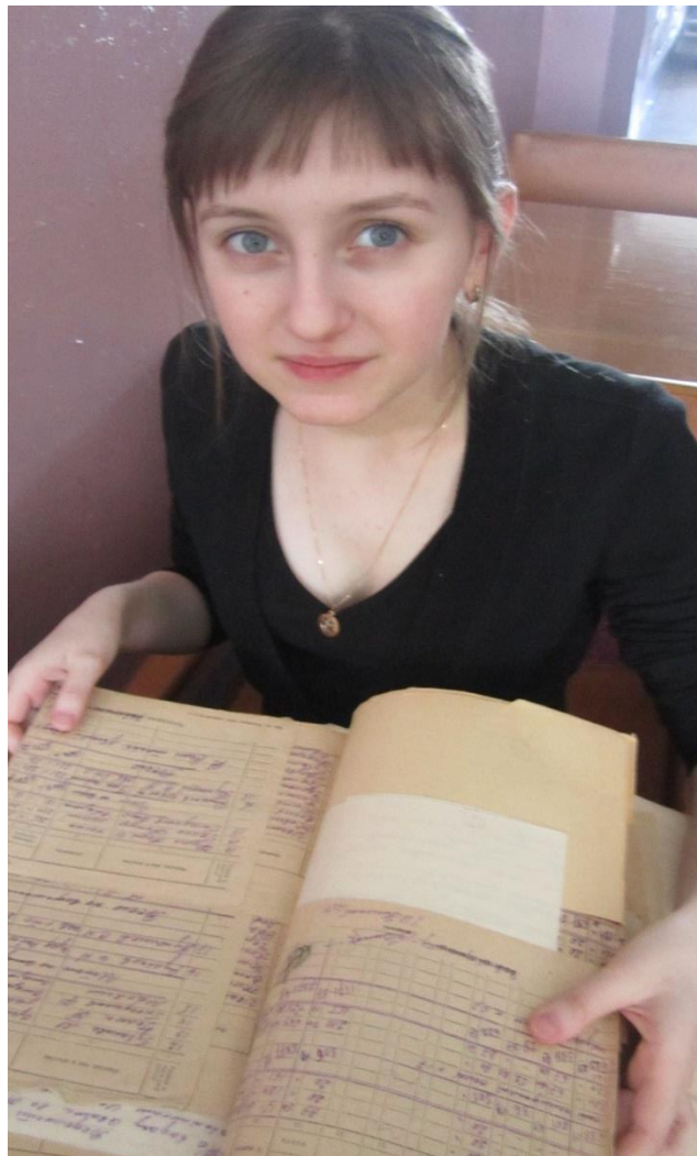
Я работаю в Назаровском архиве.