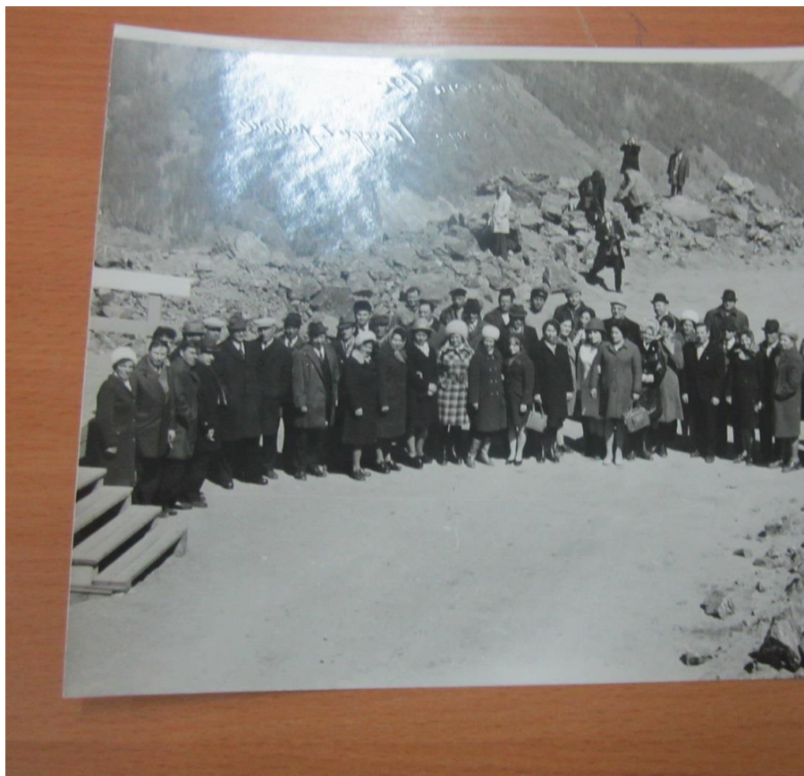
Первопроходцы-строители Назаровской ГРЭС