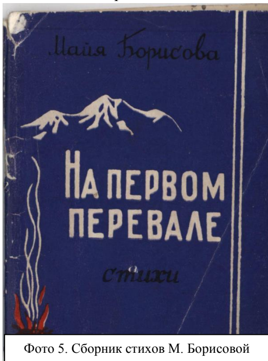
Фото 5. Сборник стихов М. Борисовой

богаче, тоньше, чем в стихах, - подумайте, стоит ли делать именно их основным занятием, основным содержанием своей жизни».