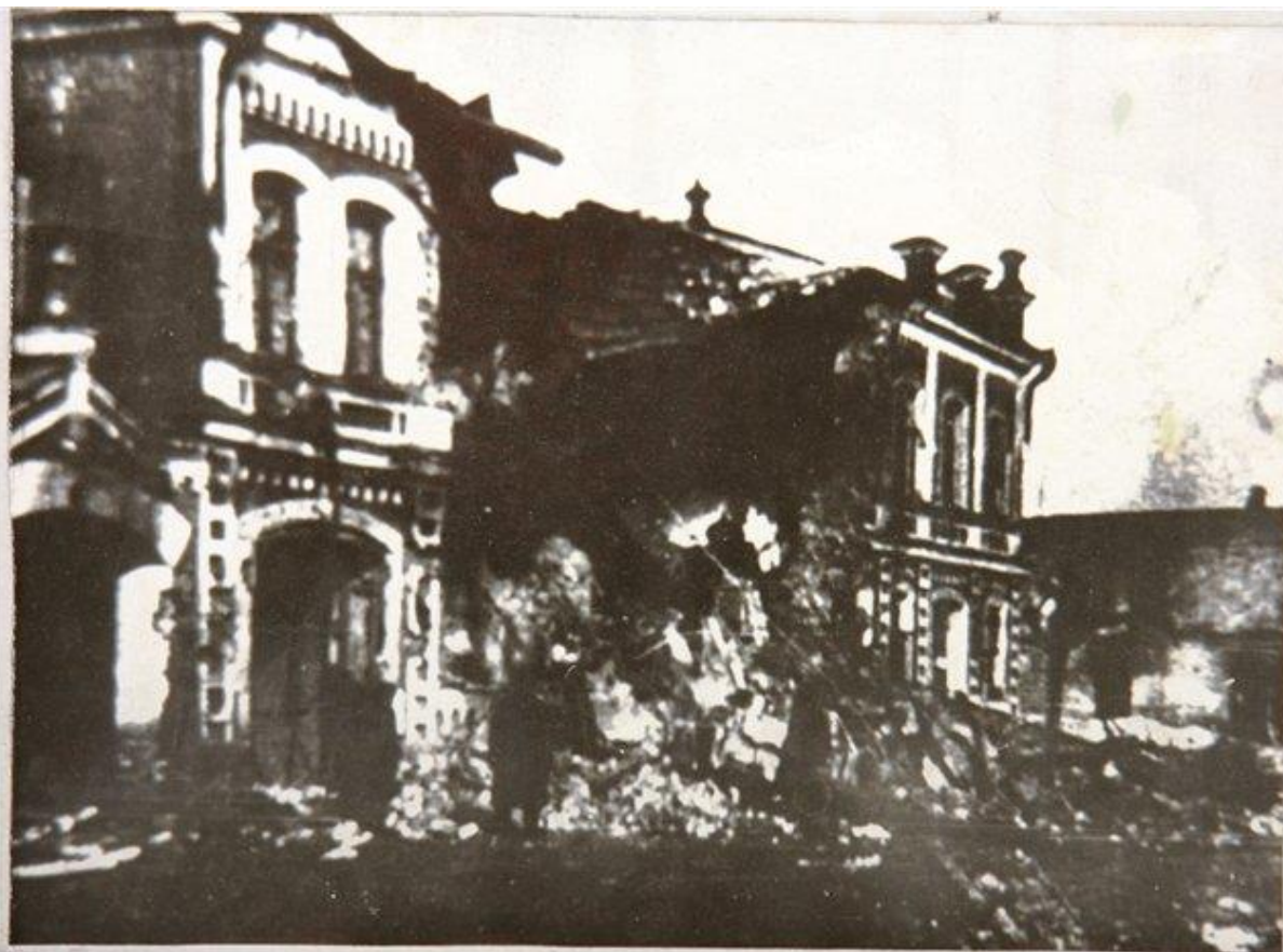
г. ЮЖНОВ. Март 1942 г.