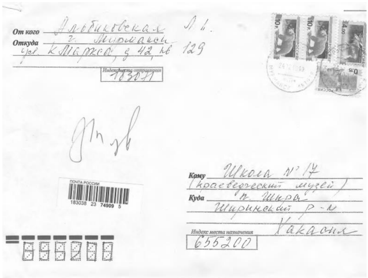
Приложения. 1. Письмо Л.К. Альбикиевской.