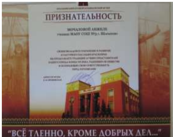
Благодарность из Краеведческого музея г. Красноярск.