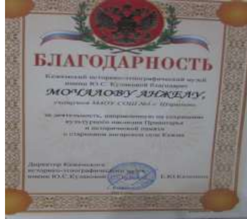
Благодарность из Краеведческого музея г. Кординск.