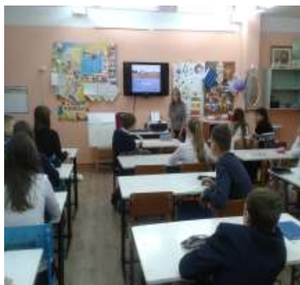
Представление презентации «Кежма. Творчество земляков» и книги «Кежма» на классном часе