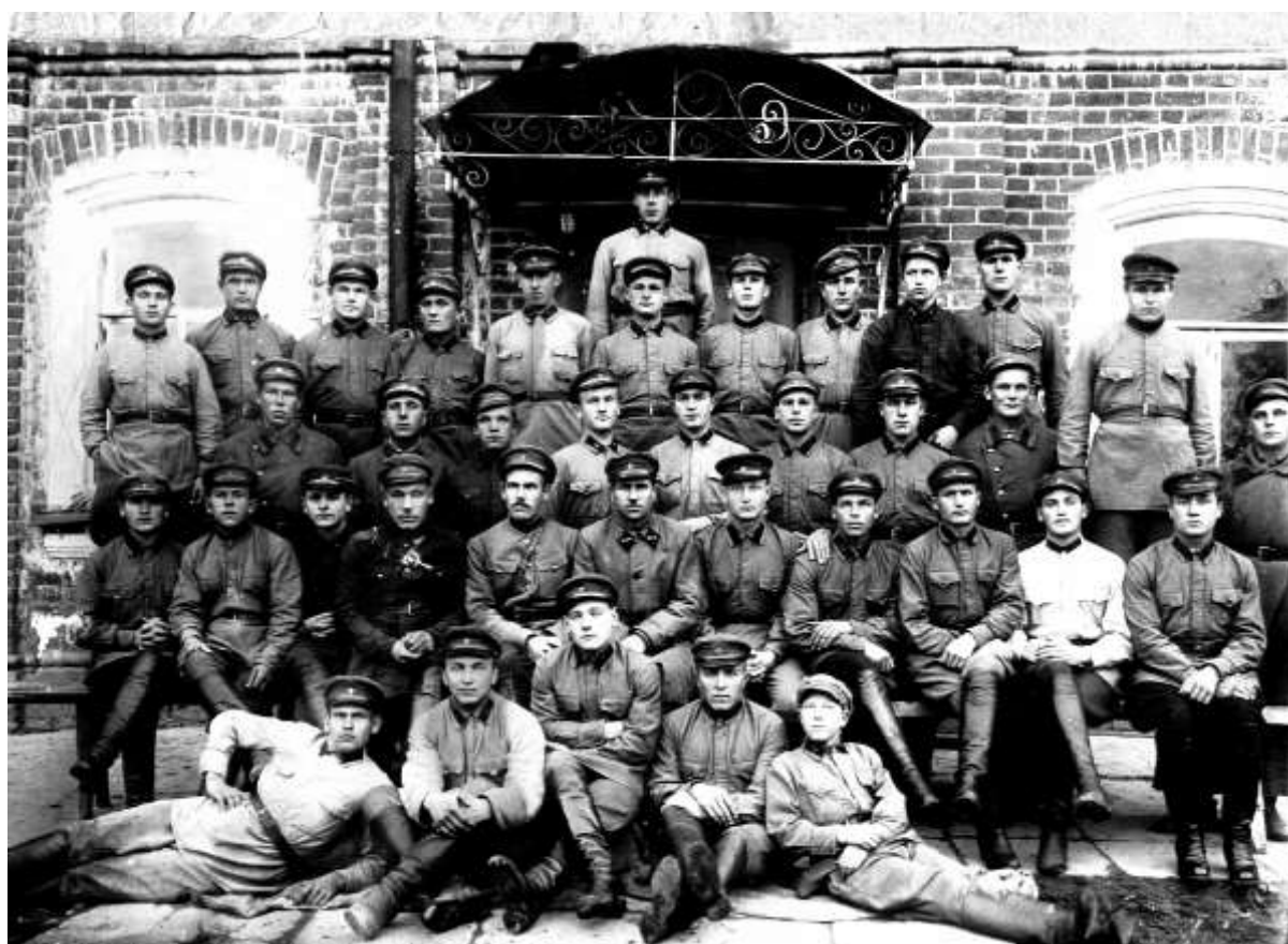
На службе в Красной Армии (1926 – 1928 г) Верхний ряд, пятый слева