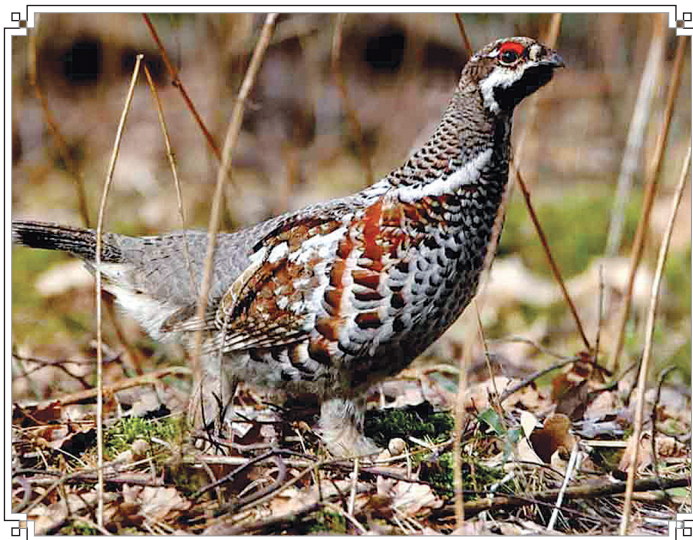
Рябчик енисейской тайги