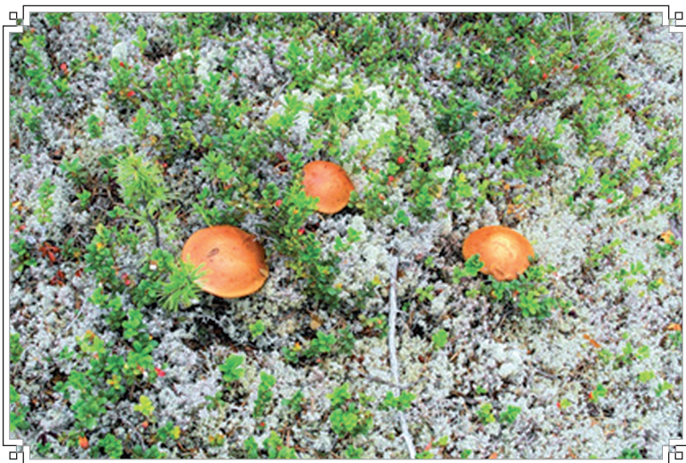
В таёжном бору