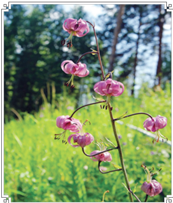
Сибирская лилия (саранка)