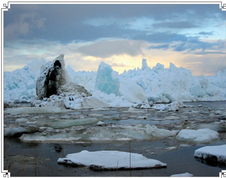
Весенний ледоход на Енисее