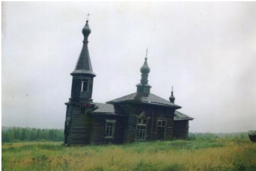
Церковь в с. Северный Катык, типовая переселенческая