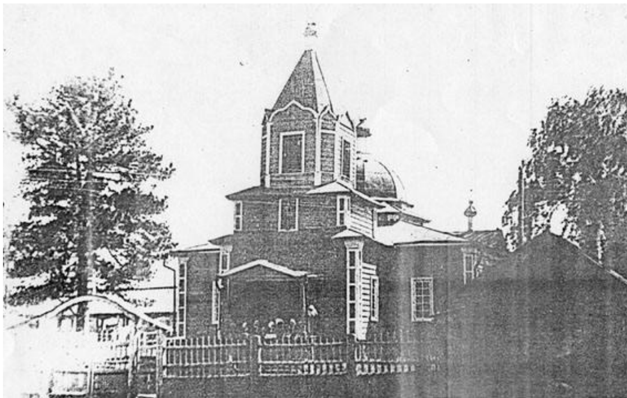
Никольская церковь в с. Большой Улуй