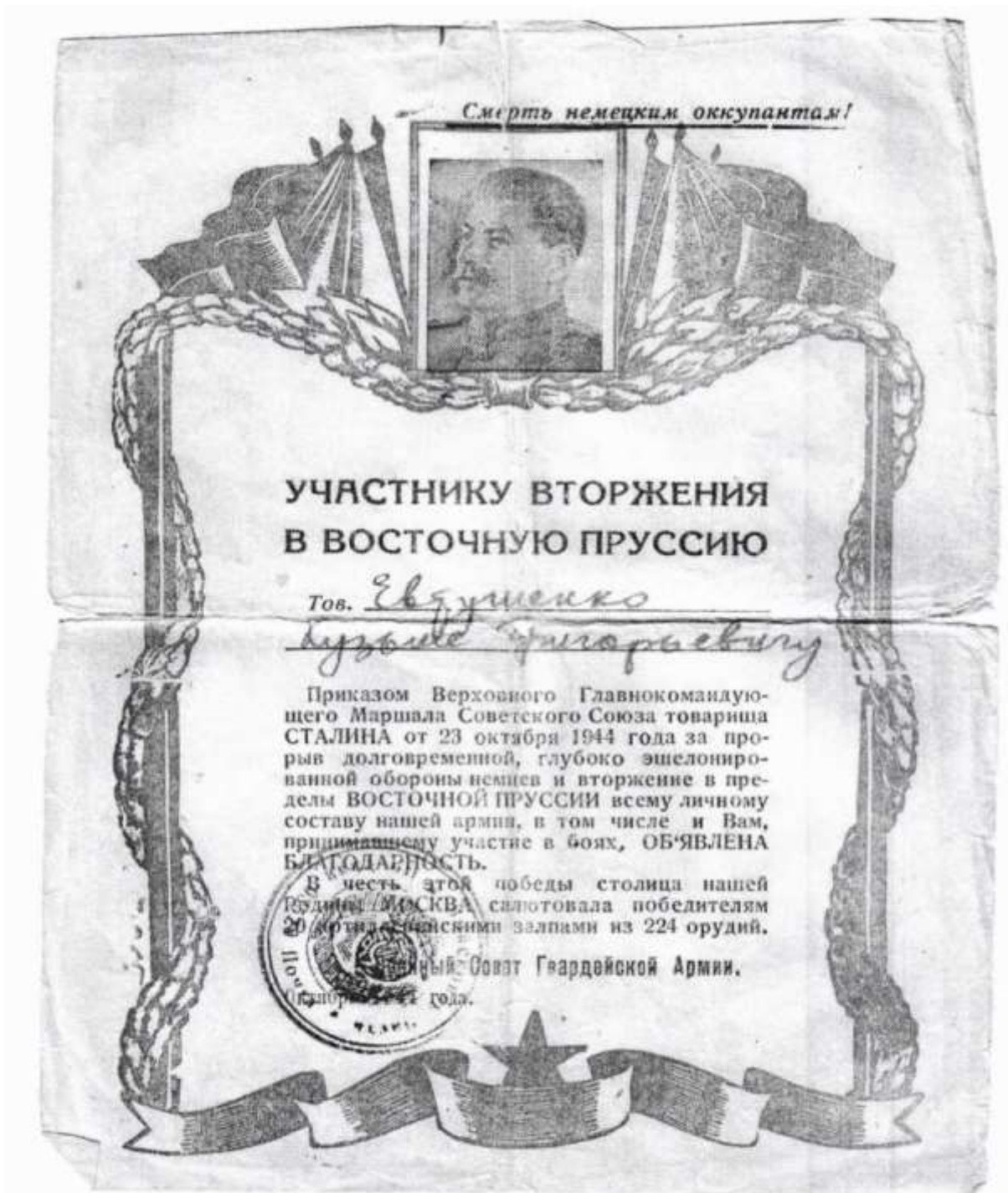
Одна из благодарностей моему прадеду.