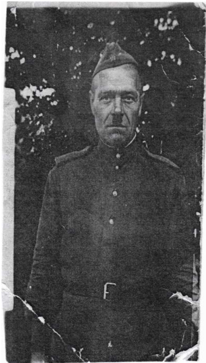
Фотография моего прадеда в во время начала ВОВ.