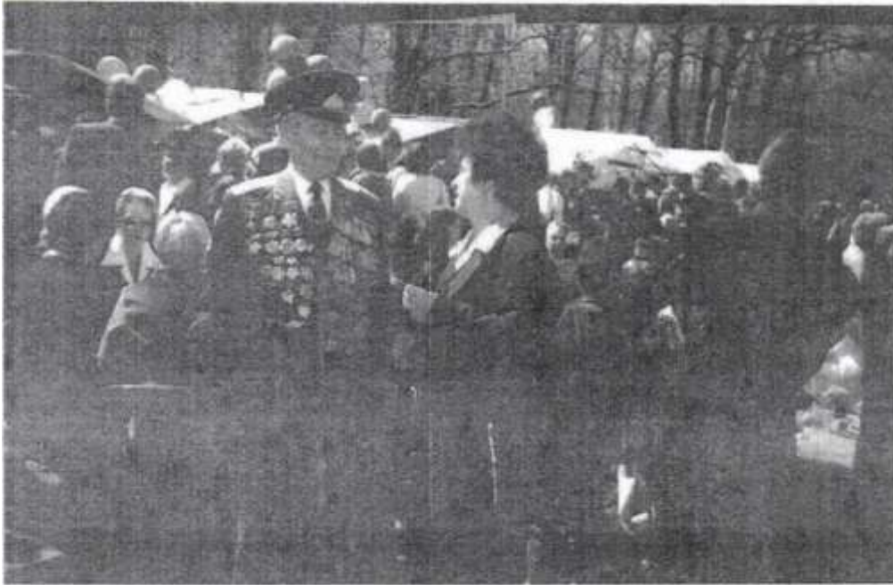
На встрече ветеранов в 2005 году.