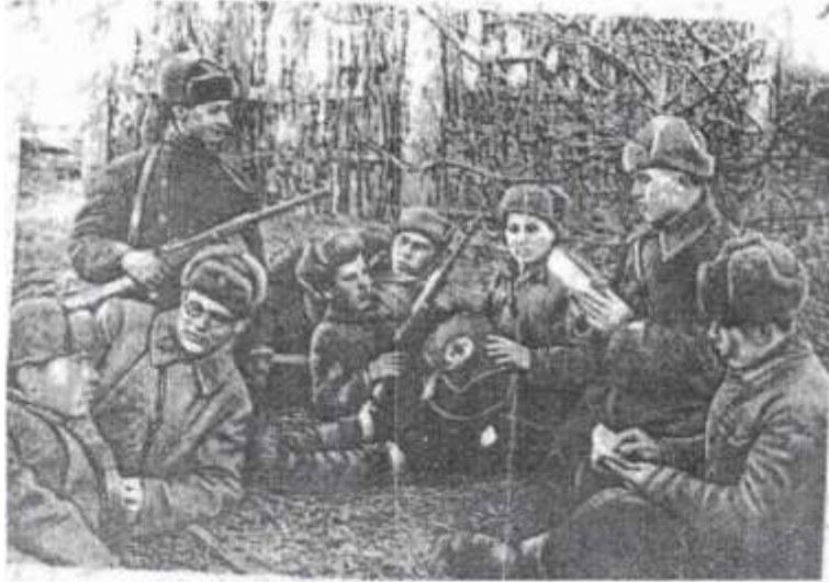
На привале