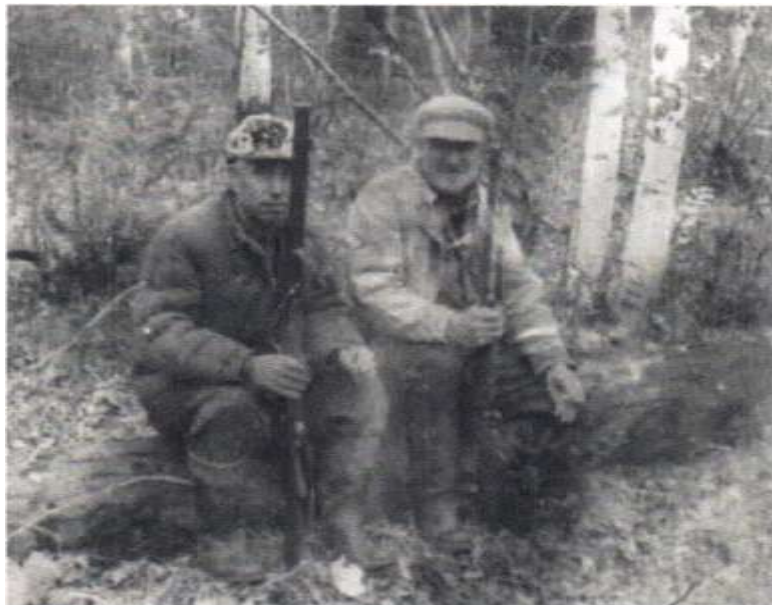
С другом на охоте.