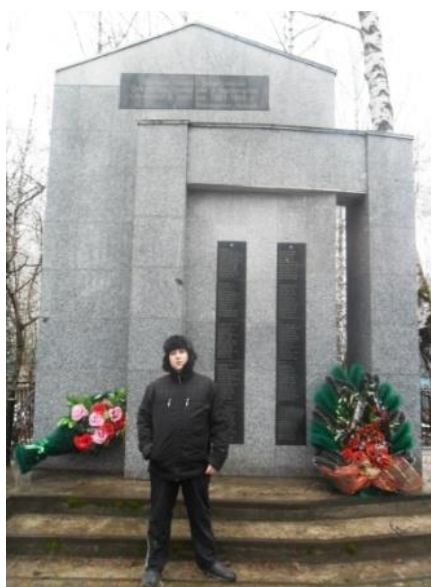
Рисунок 7. Некрополь умершим от ран в госпиталях города Ачинска, установленный в 2008 году

Фамилии 125 человек умерших от ран в госпиталях Ачинска в 2008 году были перенесены и высечены на Некрополе на городском кладбище, который был установлен вместо пирамидального обелиска 1965 года. По проекту архитектора А.В. Семененко памятник был отреставрирован и благоустроен. На лицевой стороне памятника слова "Вечная память защитникам Отечества, умершим в госпиталях г.Ачинска в суровые 1941 – 1945 гг. Благодарные горожане". В 2008 году, буквально через несколько дней после установки памятника, вандалами были сняты цепи, которые располагались по периметру [2].