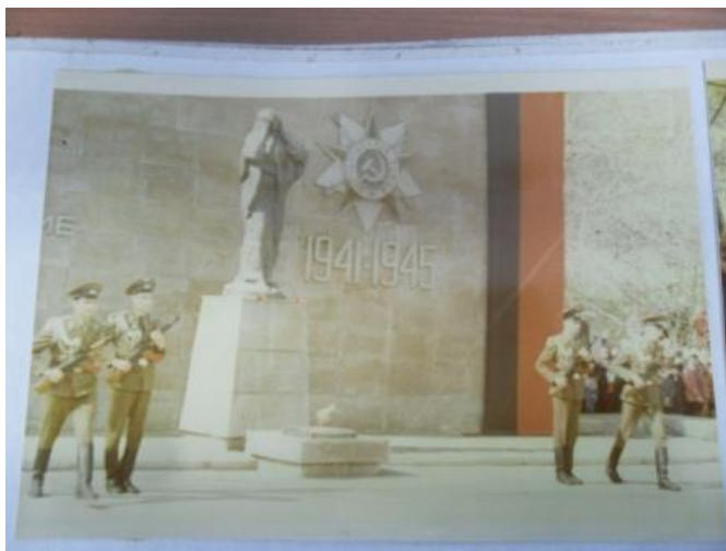
Рисунок 5. Памятник "Скорбящая мать", установленный в 1980 году [9]

женщины и вечный огонь. В 1985 г. на мраморных плитах были высечены имена умерших от ран в госпиталях города Ачинска [2].