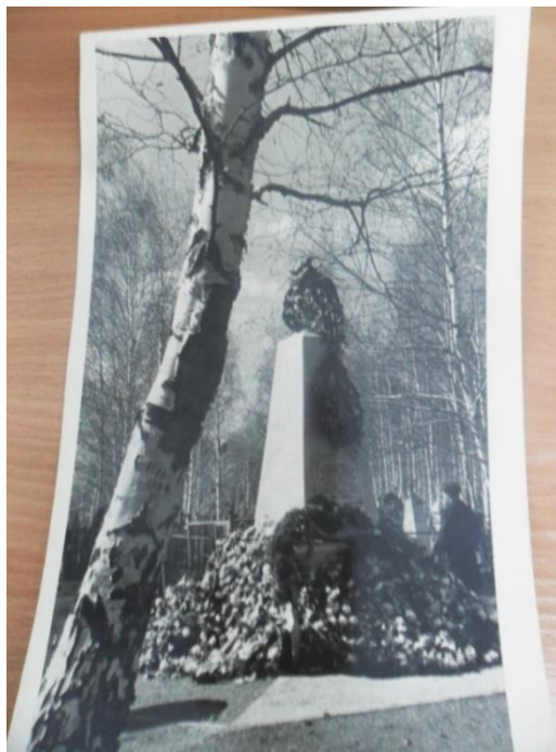
Рисунок 2. Братская могила воинов Красной армии, умерших в госпиталях города Ачинска, установленный в 1965 году [3]

Многих раненых бойцов врачи поставили на ноги, но не всех удавалось спасти. В настоящее время установлены фамилии 125 человек. Хоронили их либо по отдельности, либо малыми группами, но постоянно в одном секторе кладбища [2]. В 1965 г. в этом секторе кладбища был установлен пирамидальный обелиск из кирпича на постаменте, увенчанный пятиконечной звездой. Памятник был облицован цементным раствором. Высота обелиска – 1,7 м. На фронтальной стороне его была мемориальная доска – "Вечная память героям". Памятник находится на местной охране с июня 1980 года [10].