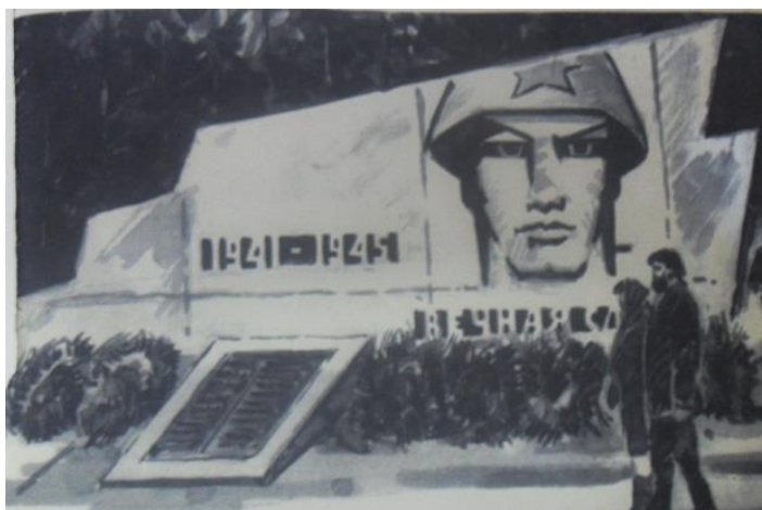
Рисунок 3. Памятник умершим в госпиталях города Ачинска, установленный в 1967 году перед городским кладбищем [5]