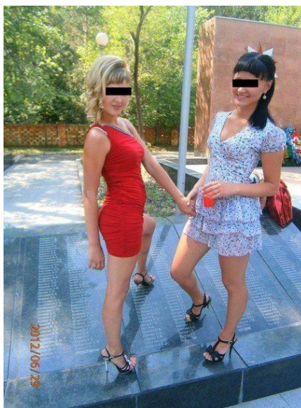
Рисунок 8. Скандальная фотосессия

Фото, вместе с другими свадебными снимками, подружки, даже не задумавшись, выложили на свои странички в социальной сети. А уже на следующий день, зайдя в Интернет, оторопели: в комментариях народ высказал все, что думает по поводу их "фотосессии"» [6]