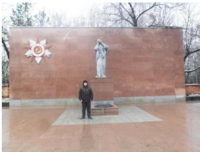
Рисунок 6. Памятник "Скорбящая мать", установленный в 2008 году

Возможность реконструкции памятника появилась только в 2008 году. На эти цели из городского бюджета было выделено 3,5 млн. рублей. Открытие мемориала "Скорбящая мать" состоялось 7 мая 2008 года. После восстановления мемориальный комплекс приобрел вполне современный вид: появились новые гранитные плиты с гравировкой фамилий всех ачинцев, погибших на фронтах второй мировой войны [8].