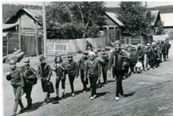
Из материалов туристического похода: