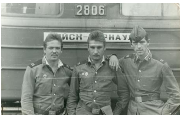
Ух и поколесили по стране