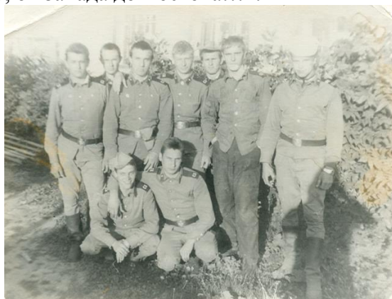
5 фотографии папы: с друзьями