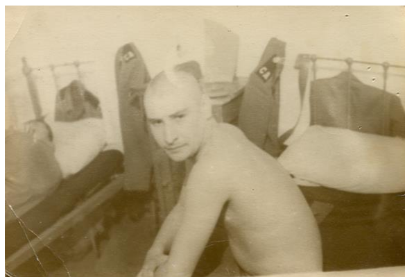
В армейской казарме на отдыхе