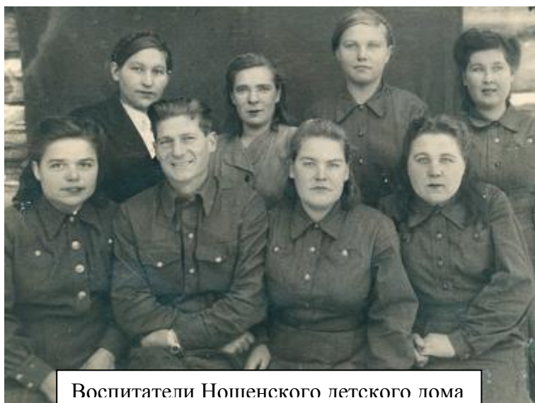
Воспитатели Ношенского летского дома