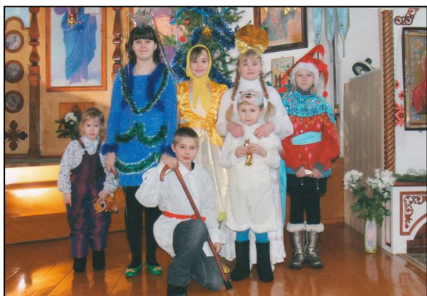
Занятия в Воскресной школе

Мы решили проблему – доказали гипотезу, достигли цели – собрали и обобщили материал о храме иконы Казанской Божьей Матери села Субботино, показали историческую значимость церкви в жизни села и людей.