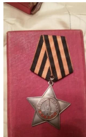
Орден славы 3 степени