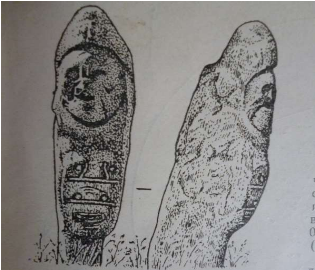
Рис. 61. Изваяние Улуг Хуртуях тас (Большая каменная старуха). Стояло на левом берегу р. Абакан близ Онха- кова улуса. Прорисовка фотографий Л. А. Евтюховой 1947 г. Песчаник. Хранится в ХОКМ