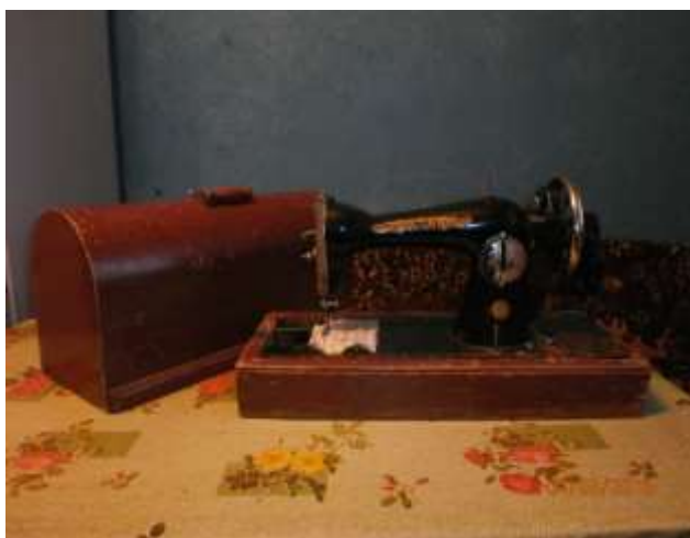
Ручная швейная машинка