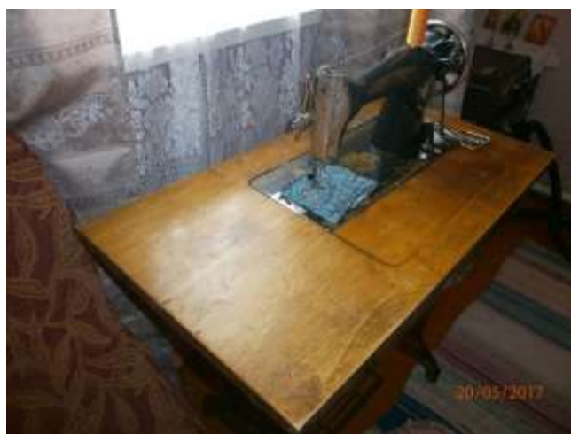
Ножная швейная машинка