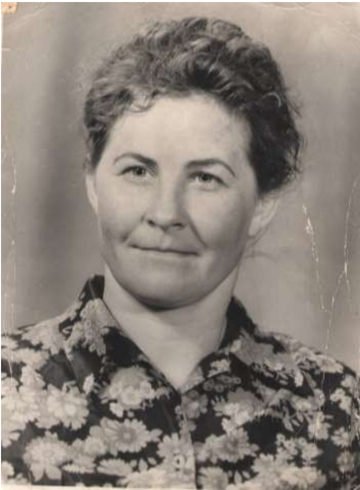
С Доски Почёта, г. Кызыл