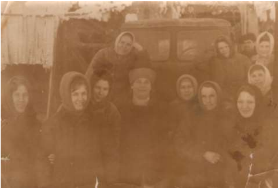
Работники бетонного завода с. Тёя