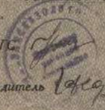
Нижнеамыльский поселковый Совет Артёмовского района, свидетельство о рождении.