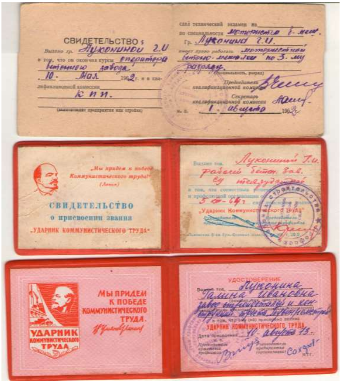
Удостоверения к трудовым наградам.