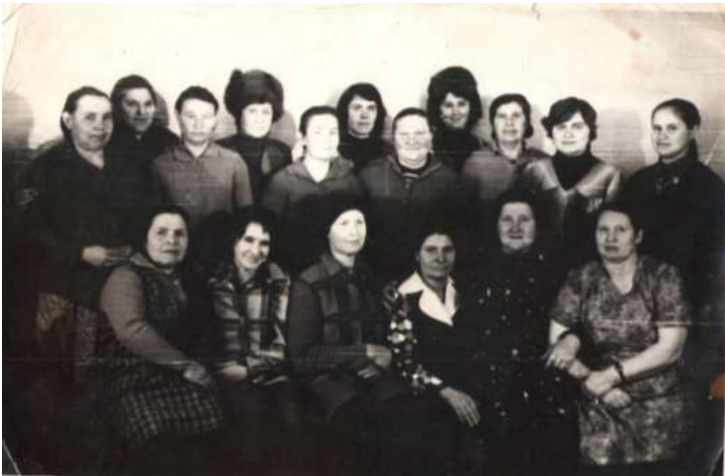
Работники Абаканского ДОКа, село Верхний Кужебар, цех деревообработки.