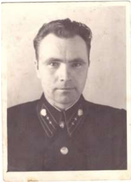
1945 год День окончания войны