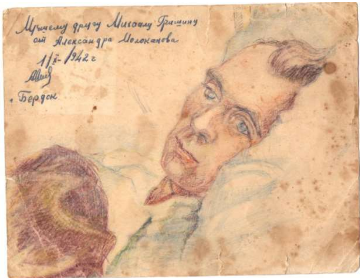
Рисованный портрет с пожеланиями. Рисовали в госпитале г. Бердска Новосибирской области