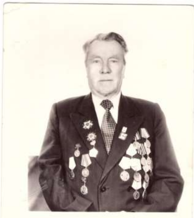
1995 год 50 лет Победе