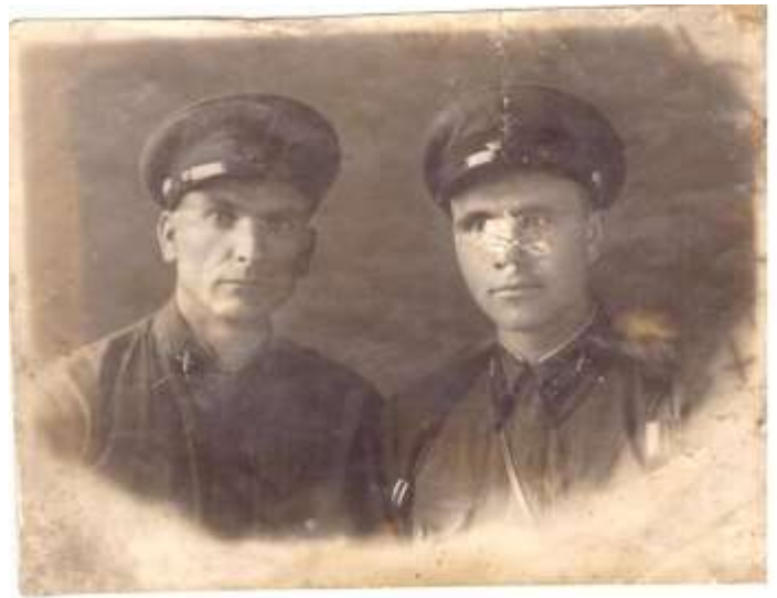
1941 год Ленинск-Кузнецк. День отправки на фронт