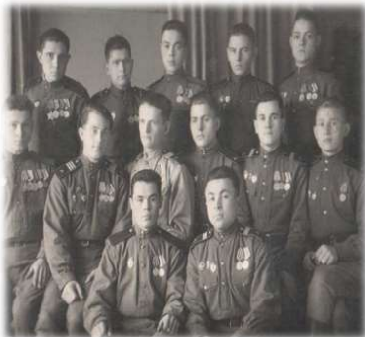
Фото с однополчанами