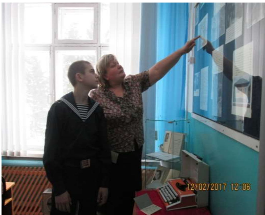
Встреча со школьным библиотекарем