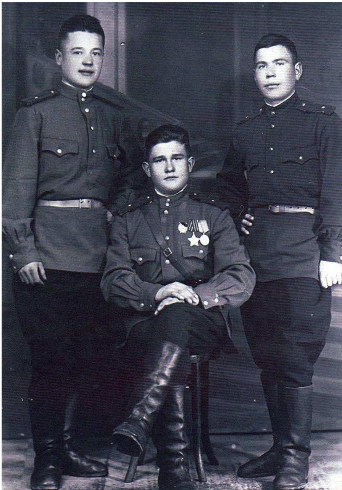
Присвоение звания «мл.лейтенант», 17.02.1945г.