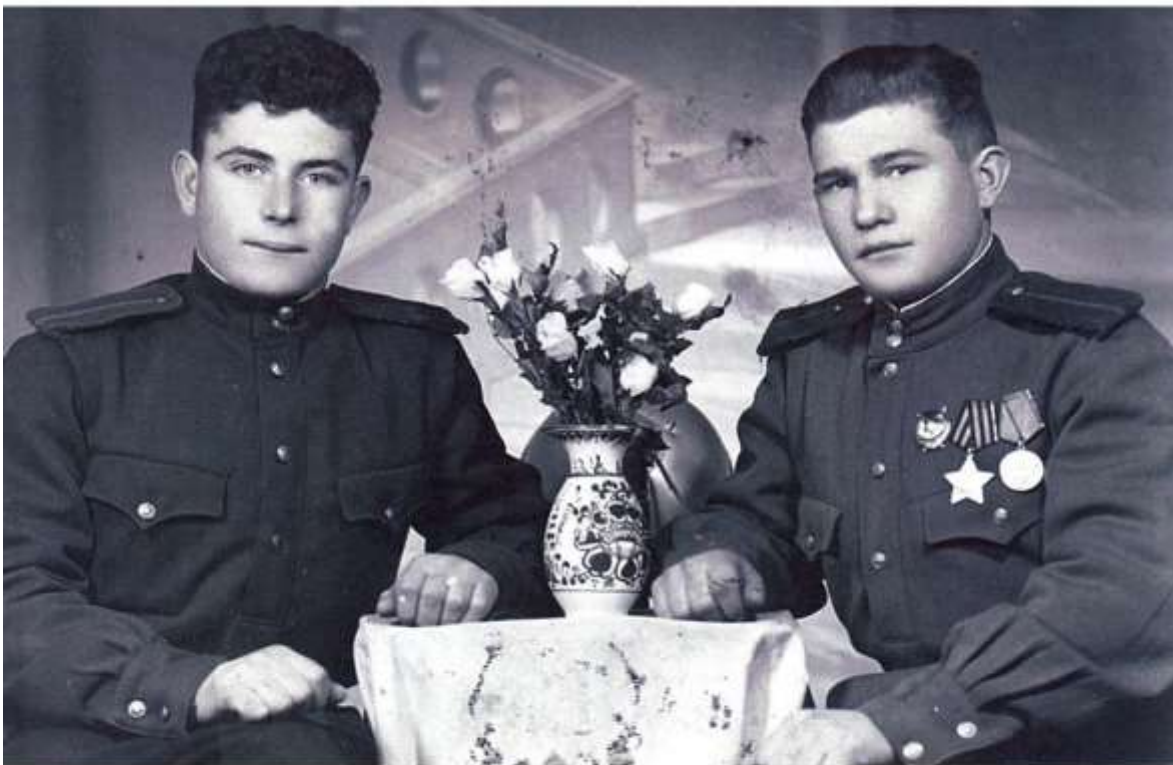
Курсы мл.лейтенантов 2-го Украинского фронта, июнь 1944г. – февраль 1945г.