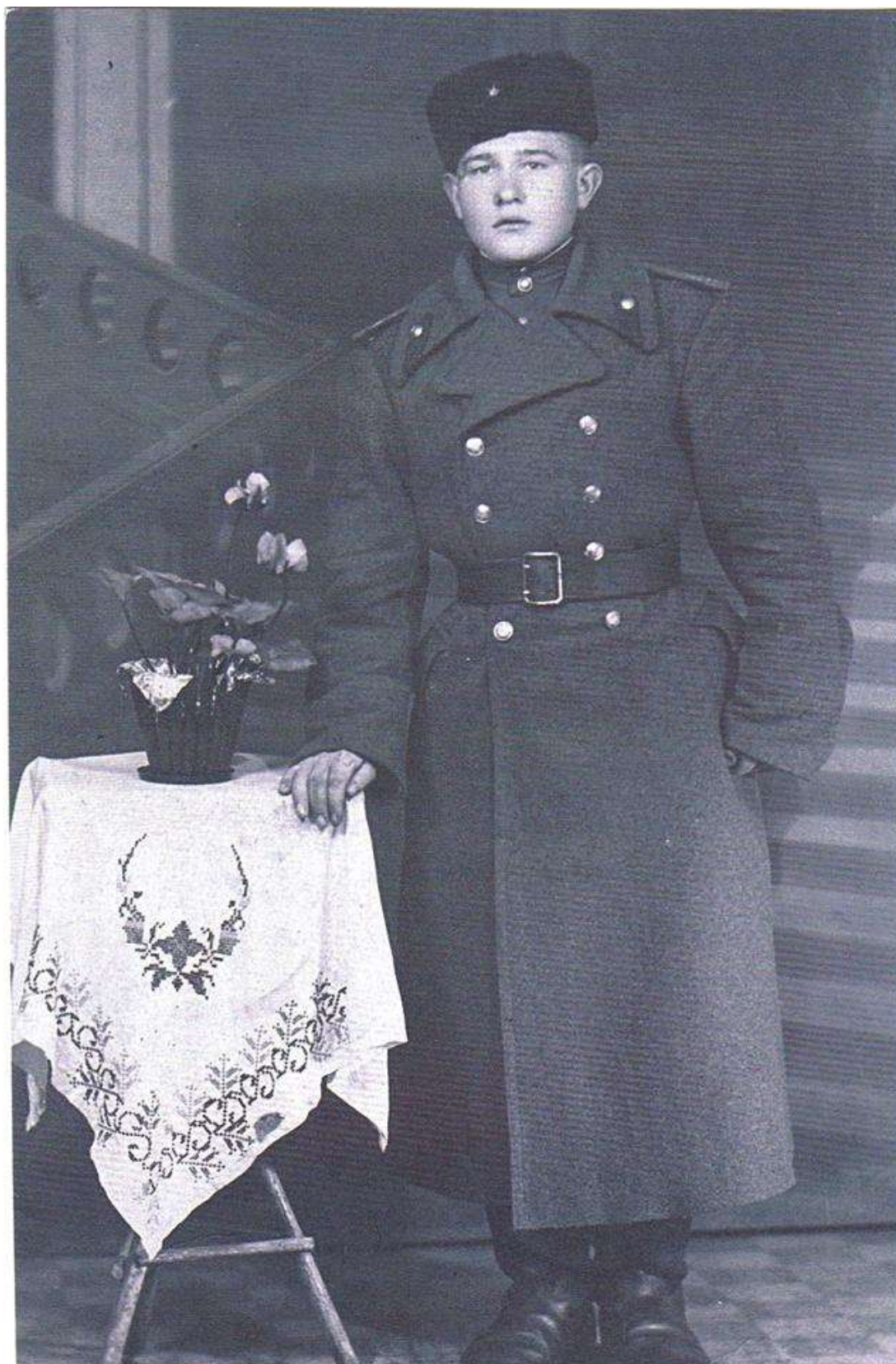
Курсы мл.лейтенантов 2-го Украинского фронта, июнь 1944г. – февраль 1945г.