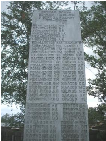
Фото № 8 Памятник ВОВ