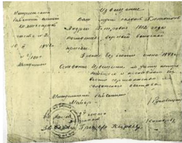
Фото № 9 Похоронка