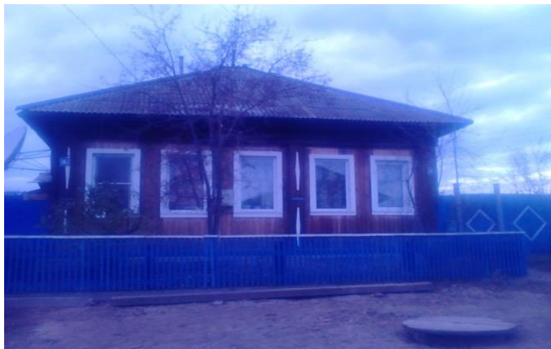
Фото № 4 Дом семьи Подоляк Ватутиных