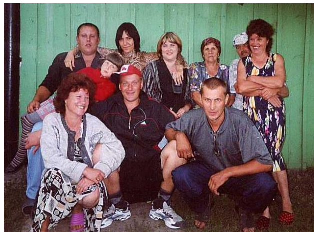
Фото № 4а Все из рода