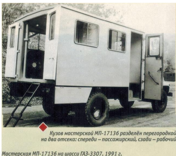
Фото № 6а