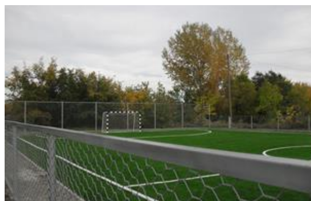
Фото № 37 Тощев А.В.