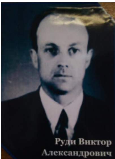
Фото № 17