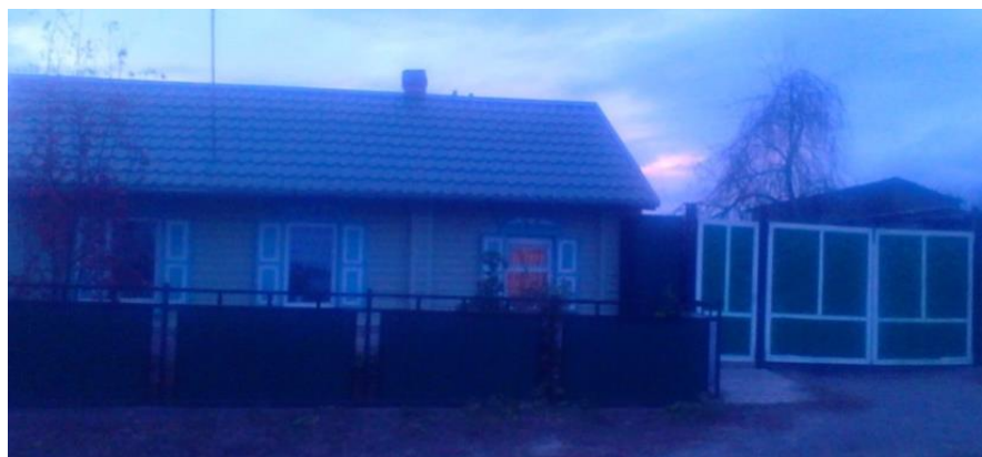
Фото № 3а Дом Терентия Ватутина