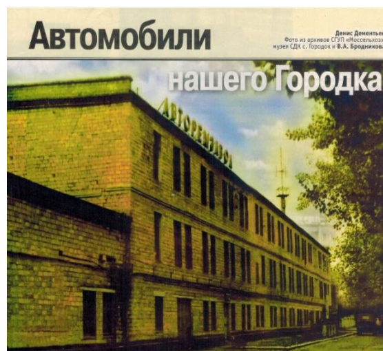
Фото № 7. Авторемзавод