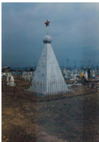
Фото № 5 Памятник Фото № 6