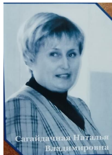
Фото № 18