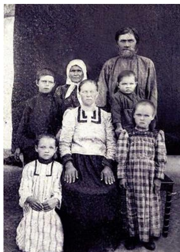
Фото № 3 Ватутины