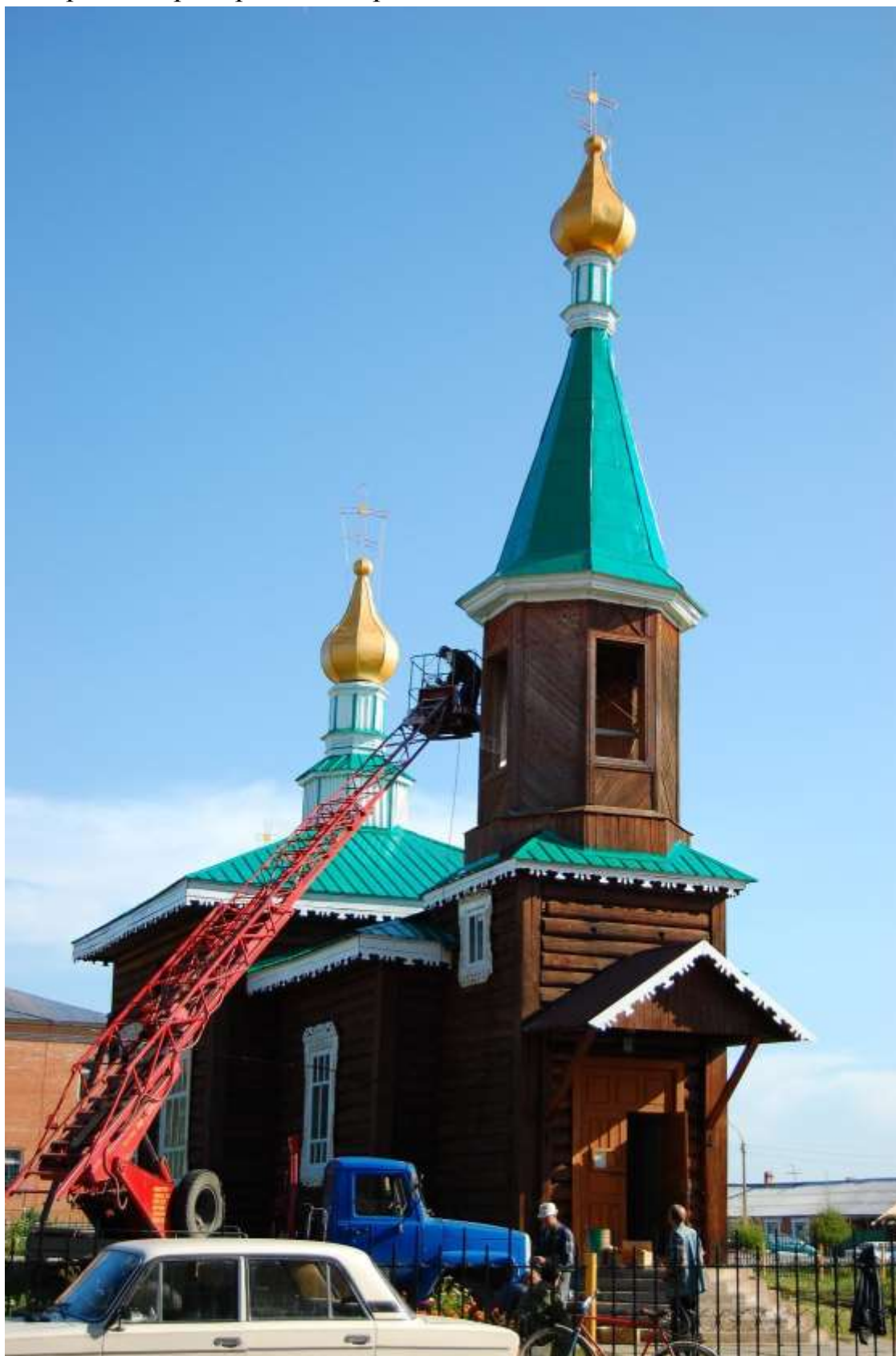
Косметический ремонт 2004г.