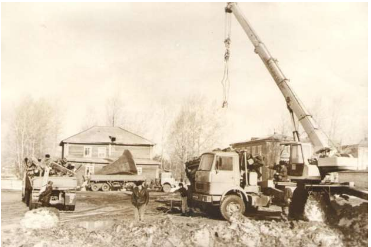
с. Новобирилюссы, 1998г.