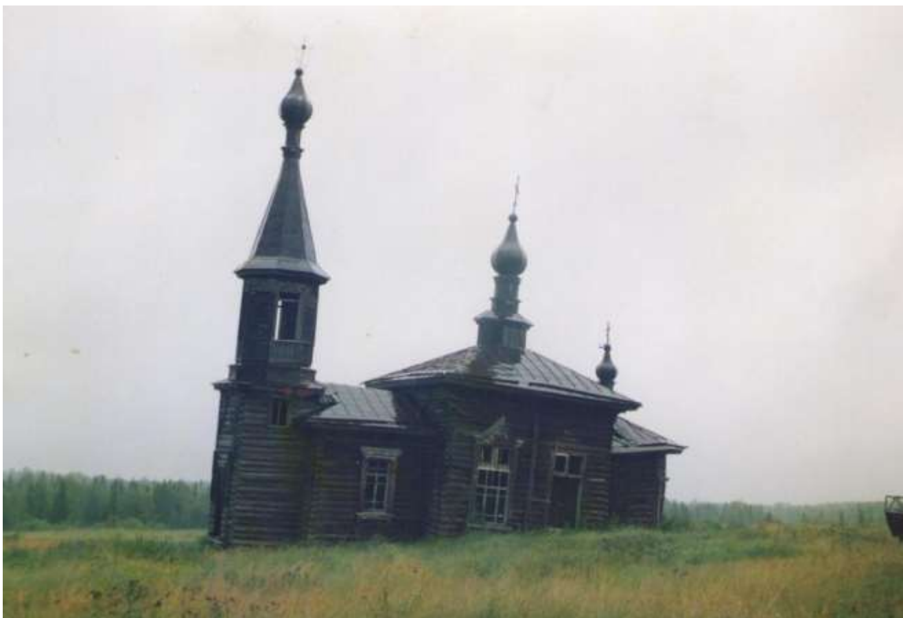
Церковь во имя Чудотворца Николая. д. Северный Катък, 1998 год.