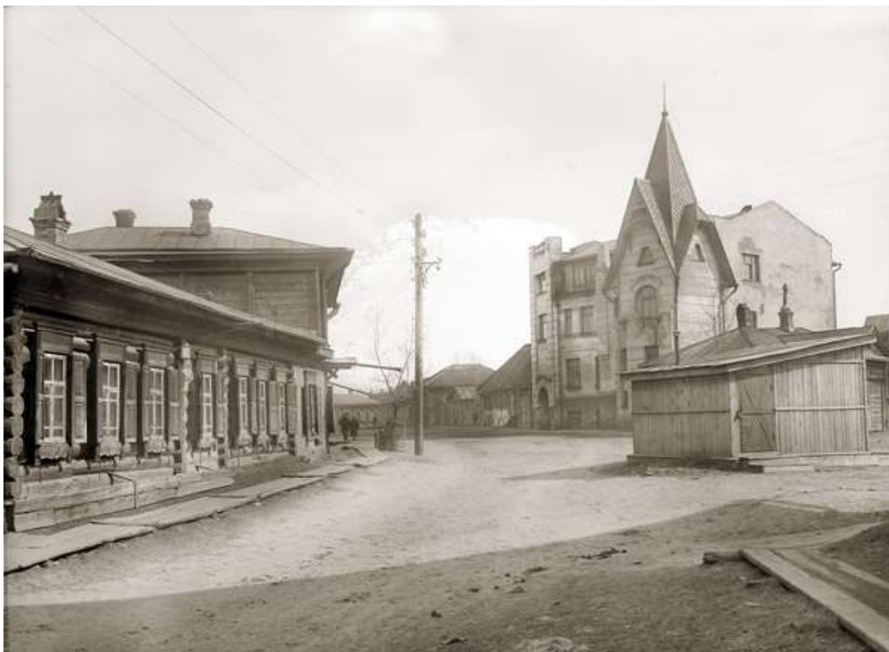
Красноярск, ул. Марковского д. 40

Типичная сибирская деревянная застройка. Рядом с такими домами частенько располагались небольшие полисадники, в которых пышно цвела черемуха, акация, сирень. Благодаря поэме Владимира Фролова отчетливо представляешь себе уютную девичью комнату в этом скрипучем деревянном доме: распахнутые окна на тихую улицу, стопочка книг на столе, посередине которого синяя хрустальная ваза с цветами бессмертника. Эти наши сибирские цветы совсем не приметные, но аромат у них тонкий и чистый.