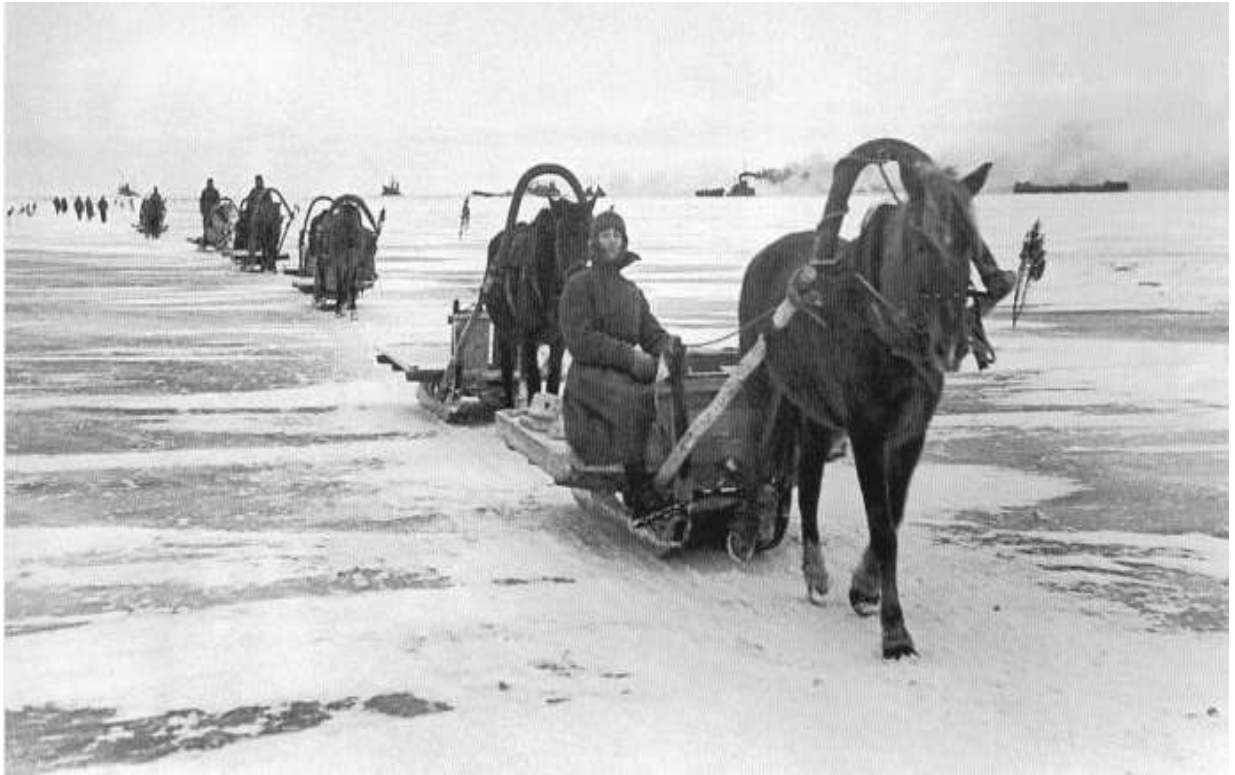
Дорога Жизни, проходившая по Ладожскому Озеру