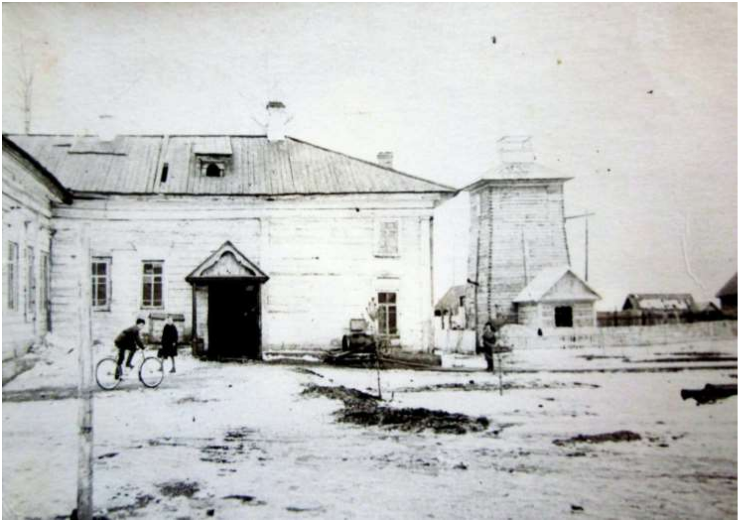
Жилые помещения в Каратузском районе для эвакуированных детей