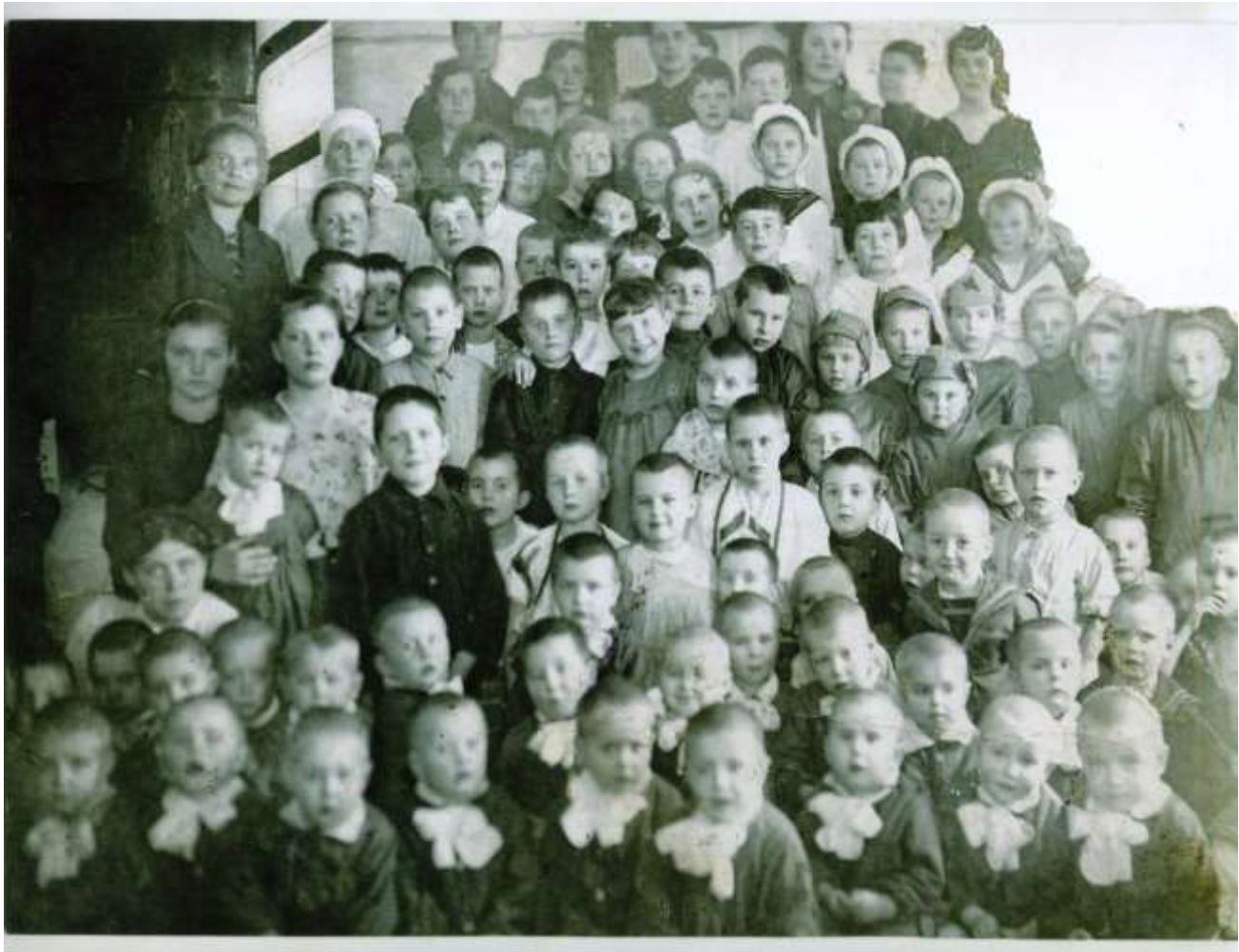
Ленинградские дети детского сада №26 со своими воспитателями в с. Каратузское