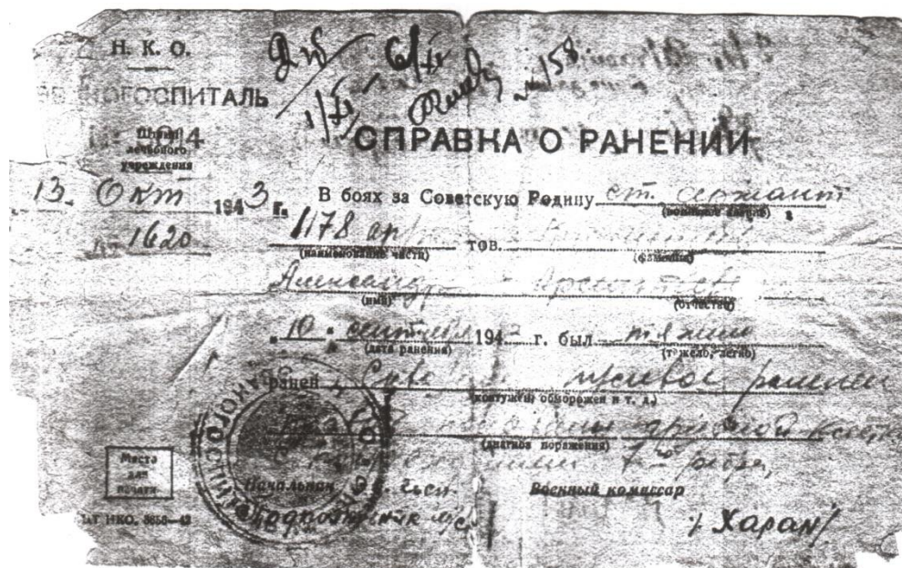
Справка о ранении из госпиталя от 13.10.1943.

Три раза был в госпиталях, но каждый раз возвращался в родную часть. В июле 1944 года награжден благодарностью за освобождение города Брест.