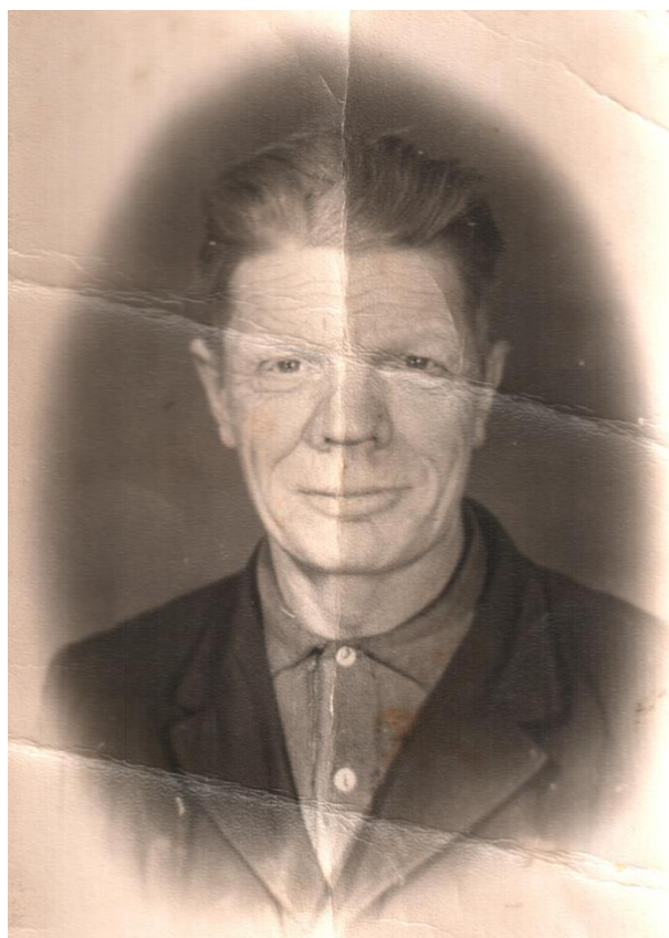
Фото прадеда после войны

Ведь сколько бы ни прошло лет, тема Великой Отечественной войны никогда не устареет, как не может обесцениться подвиг ради своей Родины, самопожертвование ради других людей. Память об ушедших защитниках Родины должна жить в наших сердцах вечно.