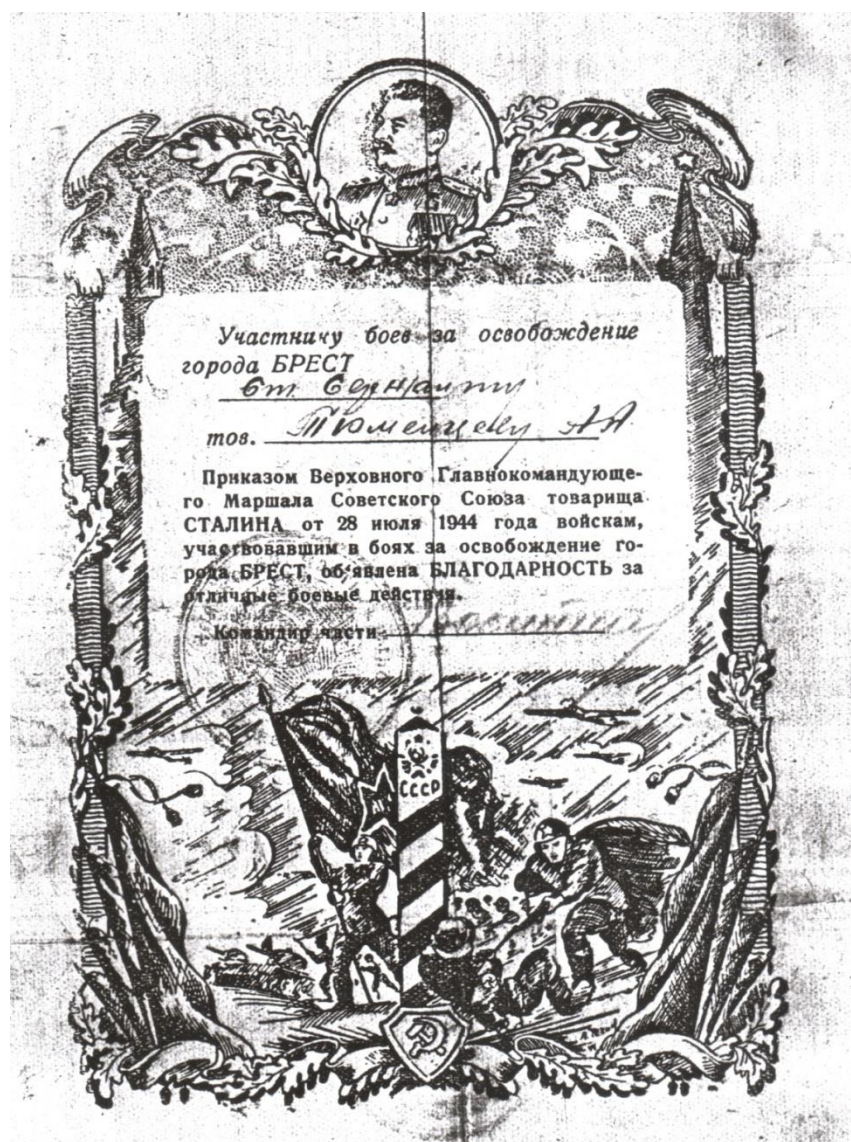
Благодарность участнику боев за освобождение города Брест от 28.07.1944 г.

Три раза был в госпиталях, но каждый раз возвращался в родную часть. В июле 1944 года награжден благодарностью за освобождение города Брест.