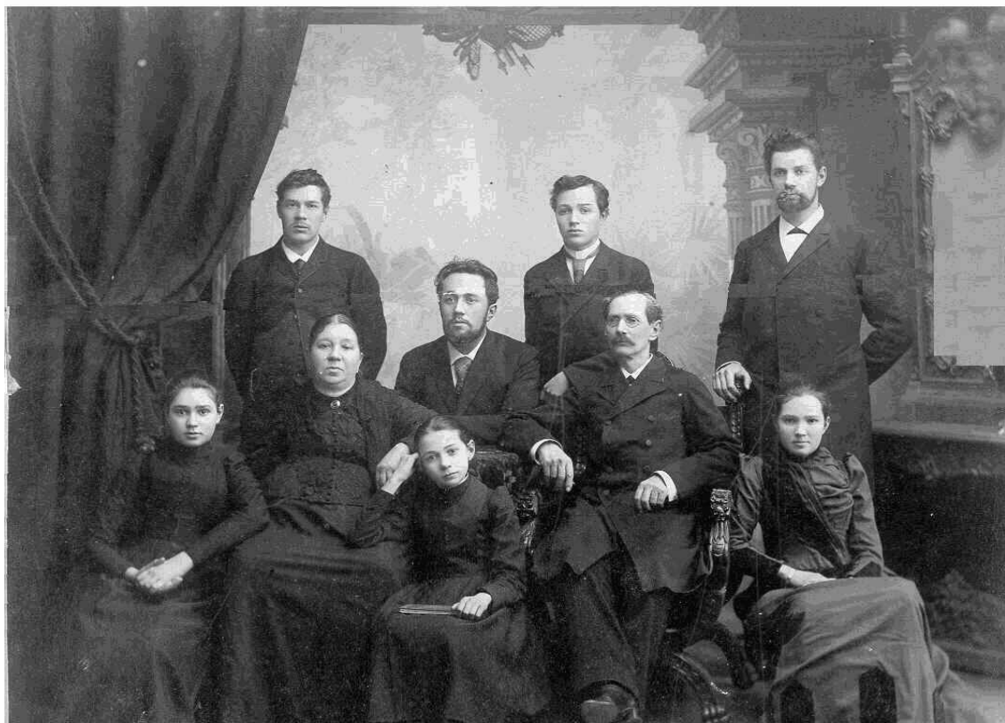
г. Саратов 1893 год.

На имеющейся у нас семейной фотографии, сделанной в 1893 году, через 18 лет после обоснования семьи в Саратове, все дети уже взрослые. Главе семейства 63 года.