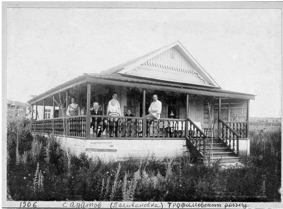
г. Саратов. 1906 г. Эту дачу снимали мои родители на Трофимовском разъезде. На террасе: дедушка, мама с Ромочкой, бабушка в кресле-каталке, папа.